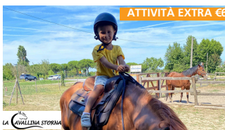
ATTIVITÀ EXTRA €6

3 ore a settimana durante l'orario del Centro Estivo nelle giornate del lunedì, martedì e giovedì mattina