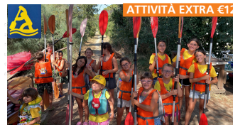
ATTIVITÀ EXTRA €12

Dopo la prima esperienza andata alla grande, abbiamo deciso di replicare per la seconda stagione le lezioni di SUP con la nostra LALLA (lezione da 1 ora)