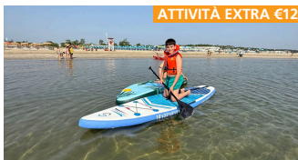
ATTIVITÀ EXTRA €12

Tutti i giorni giocheremo sui nostri divertenti e unici scivoli d'acqua con tanti giochi in piscina.