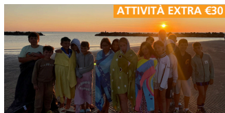
ATTIVITÀ EXTRA €30