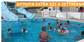
ATTIVITÀ EXTRA €25 A SETTIMANA