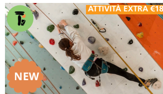
ATTIVITÀ EXTRA €18

Tutti alla Piadineria "Il Chiosco di Lido Tu... lo.. & La Piada" Via Stella Polare 1 Lido di Classe a preparare gustose piadine con le nostre manine.