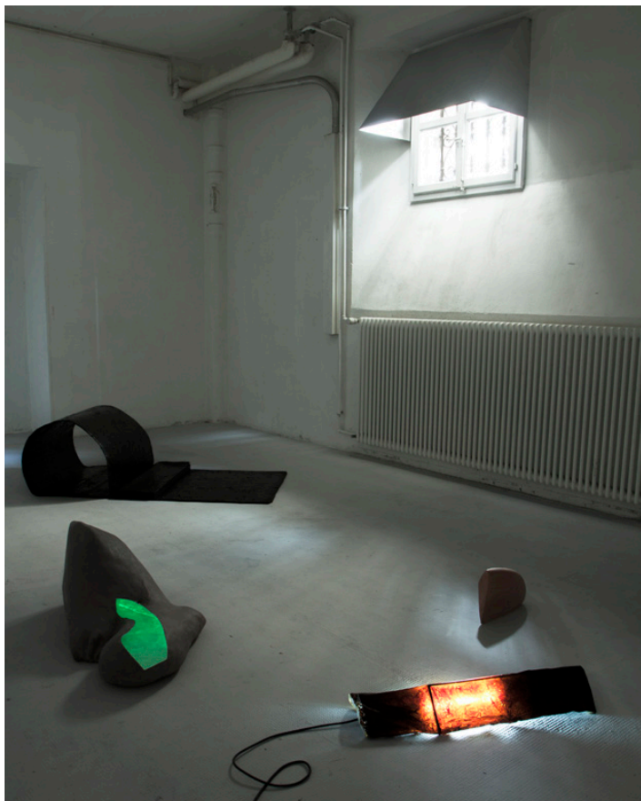
Lampe technique (en haut de l'image) 104 x 68 x 72 cm 2016

Il est possible de ne pas la remarquer. Fabriquée au format de la fenêtre, cette lampe rabat la lumière du jour, créant un espace de confort fait de zones d'ombres et de lumières, pour les autres pièces.