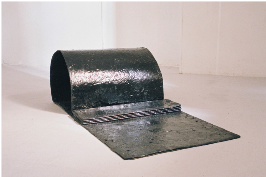
Lock-out ou This might be the bed used by the resident of the house 87 x 170 x 58 cm 2016

C'est une route fainéante, ne se portant plus qu'elle même, faite d'une matière lourde, pâteuse, imperméable, qui absorbe la chaleur et réfléchit la lumière, qui bouge encore imperceptiblement. Une route pliée sur elle même comme si un personnage de Tex Avery avait dérapé dessus, mais qui pourrait aussi être le lit d'un animal inconnu.