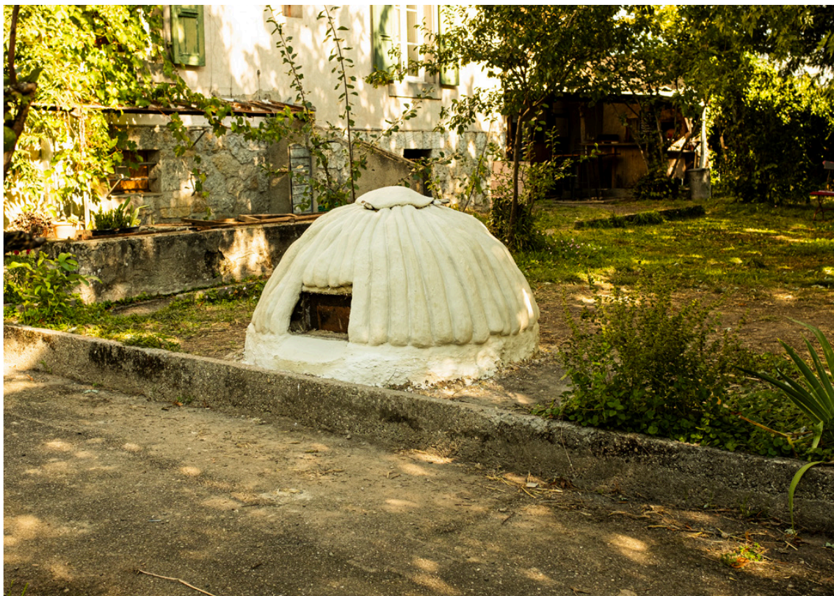
Objet attaché#7 — Double peau, 140 x 140 x 110 cm 2024

Objet attaché#7 Double peau , a été réalisé en septembre 2024 en collaboration avec Luca Guizzo dans le jardin de l'association Foehn à Genève. Le four est recouvert d'une peau extérieure faite de boudins de tissus remplis de torchis (voir image de droite du chantier en cours). Ce revêtement est maintenu à l'écart de la surface du four par des excroissances de terre. L'espace vide ainsi créé permet à l'air de circuler, ce qui isole la double peau et évite les dilatations de surface dû à la chaleur lors des cuissons.