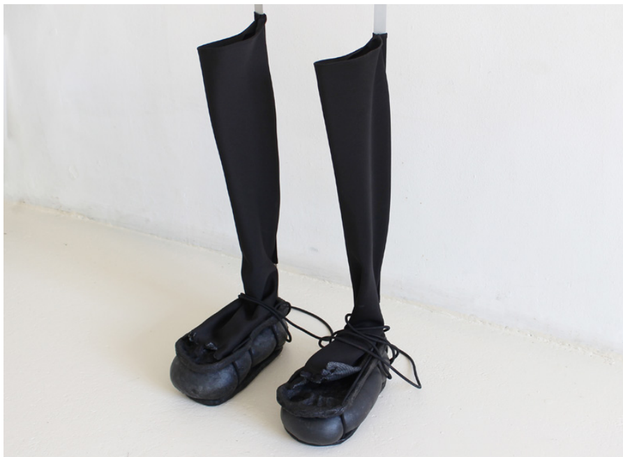
Shrew travelling boots 27 x 35 x 70 cm 2018

Cette pièce et les deux suivantes ont été présentées lors de l'exposition Pneumate à la galerie Mezzanin. Pour voir plus d'images de l'exposition http://galeriemezzanin.com/exhibitions/head-gallery-prize/