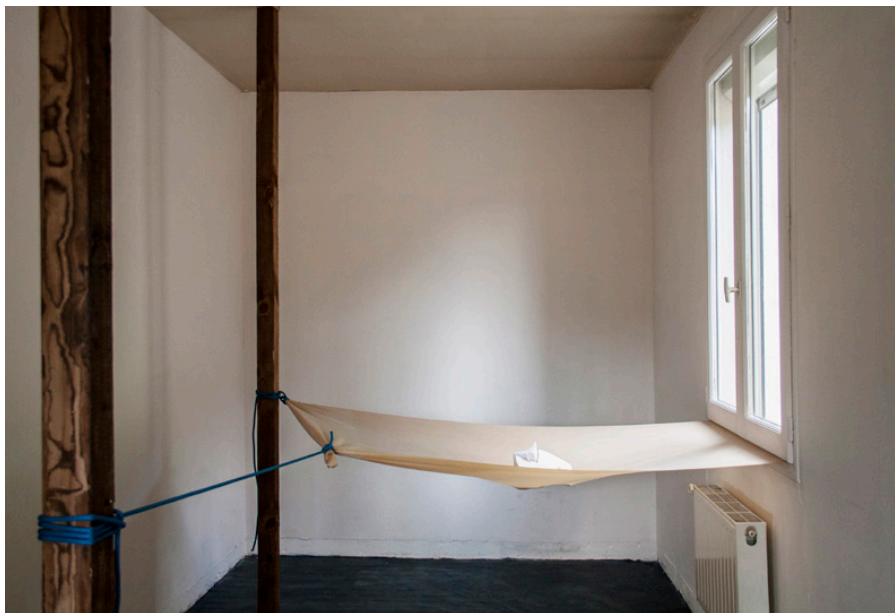
Osselet 320 x 390 x 110 cm 2015