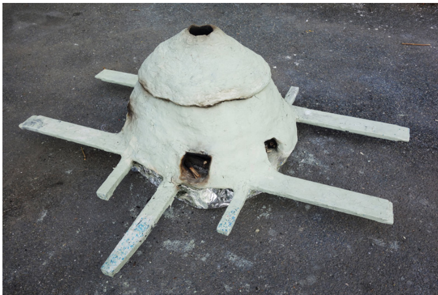
Four fantôme 110 x 120 x 61 cm 2018

Commande réalisée pour l'exposition le fantôme d'une puce , cette pièce est un four à céramique à usage unique en papier et argile qui a servi à cuire des éditions en terre. La température atteinte en fin de cuisson détruit le four, tout en permettant aux pièces qu'il contient de cuire suffisamment.