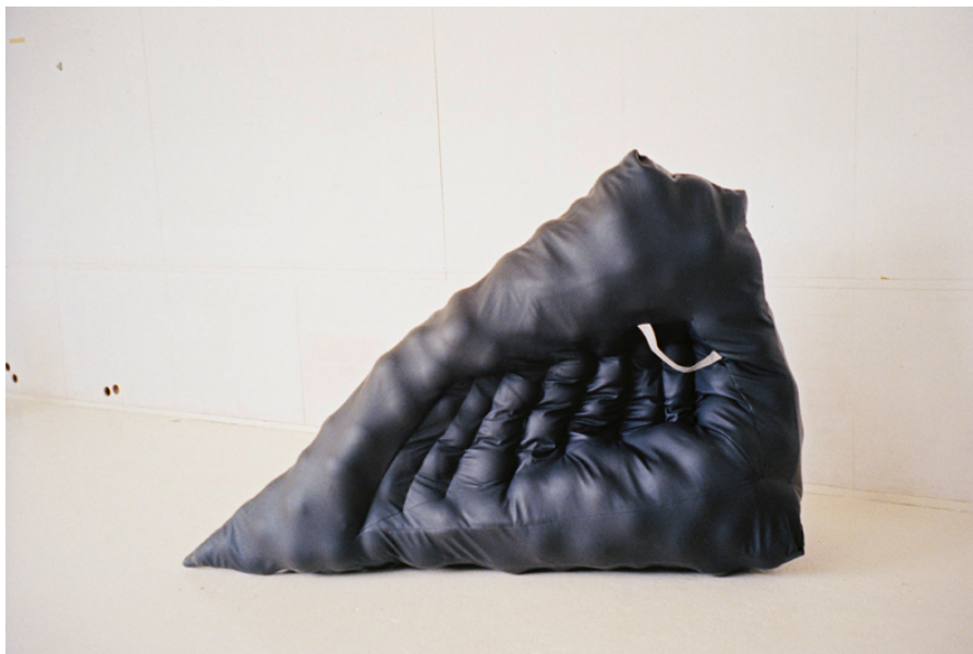
Tout les spécialistes du sujet ont disparus 148 x 259 x 83 cm 2017

Un canot gonflable à poignée, une combinaison de survie — débarrassé des spécialistes on sait finalement mieux à quoi s'en tenir. Sauf quand il s'agit d'assurer l'étanchéité à l'air.