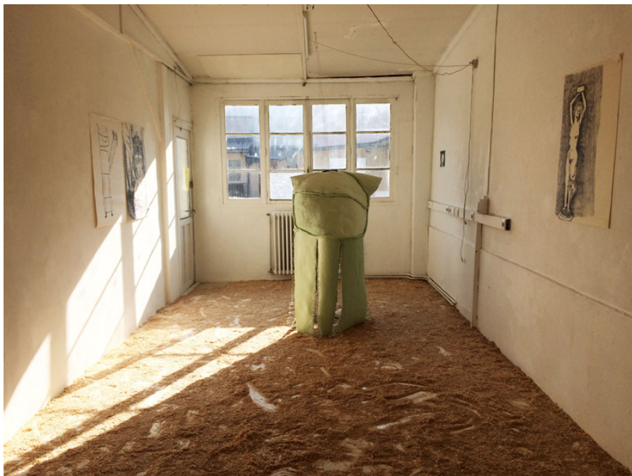
Armure 155 x 122 x 109 cm 2020

La pâte à papier est imbibée de gomme arabique puis appliquée sur le velours qui crisper en séchant. Cette sculpture est aussi une armure qui sera associée au personnage de Jeanne d'Arc dans un film réalisé par la vidéaste Gaëlle Cognée.