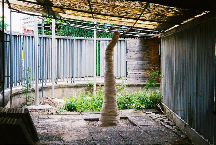
Objet Attaché#2 — Appelle moi Samantha 48 x 45 x 197 cm 2017