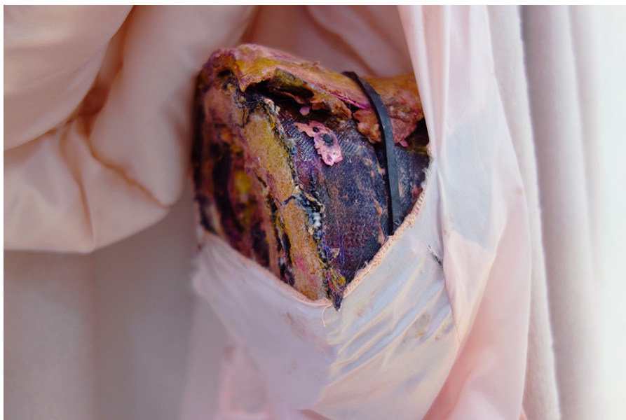
Roll 26 x 23 x 17 cm 2020

Cette pièce est une compression de restes d'ateliers roulés puis coupés en tranches. Elle a été conçue pour être présentée dans une poche de la doublure d'une grande robe de chambre réalisée en collaboration avec les membres de l'artist run space Pauline Perplexe pour Paris Internationale 2020, (invitation de Claire Lerestif).