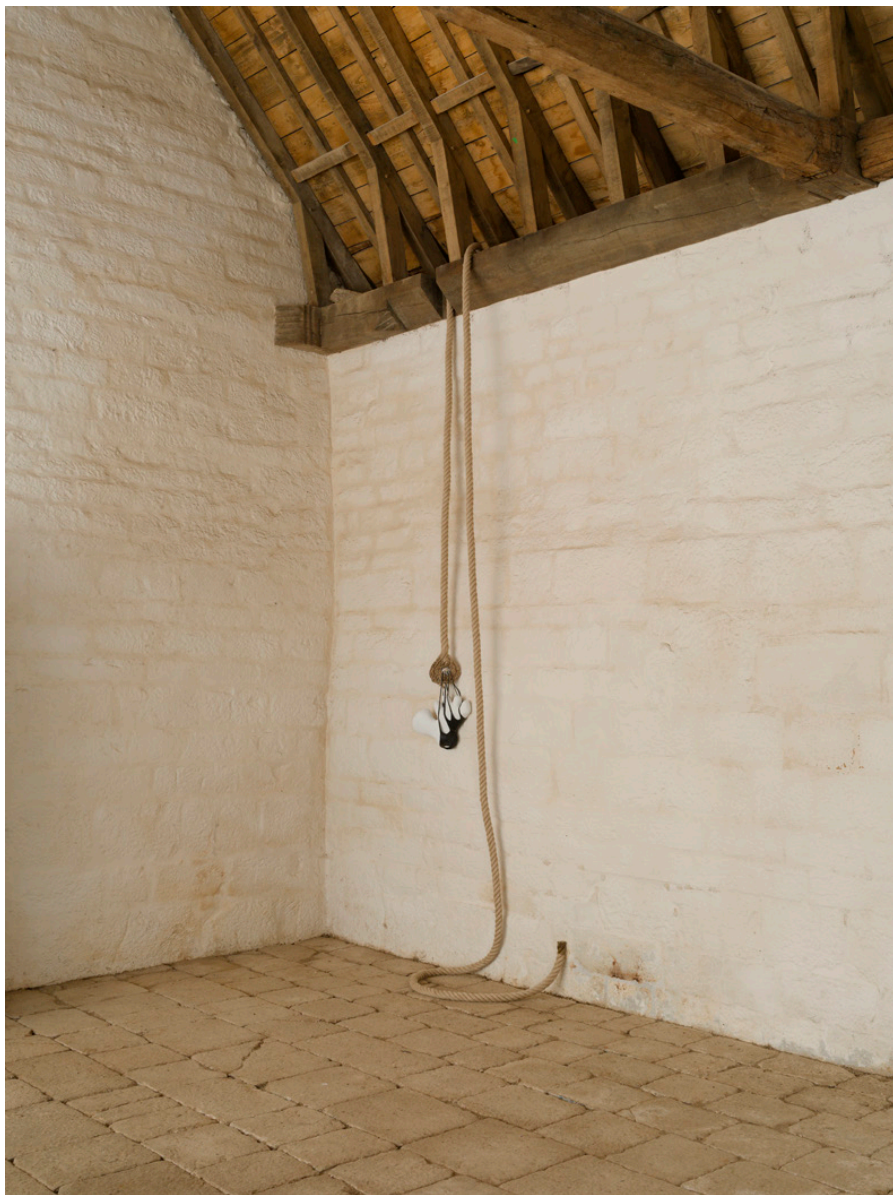
Chair bis 37 x 14 cm x hauteur variable 2025