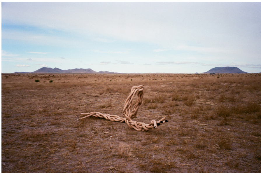
Test 410 x 120 x 27 cm 2019

Pour réaliser cette pièce, des tubes de tissu gonflés de ballons allongés sont enduits d'un mélange d'argiles puis tressés. Une fois sèche, la forme creuse, solide et légère vacille sous les vents forts du desert. Il suffit de plonger la forme dans l'eau pour la débarasser de sa coque structurante. Pièce réalisée en collaboration avec Luca Guizzo.