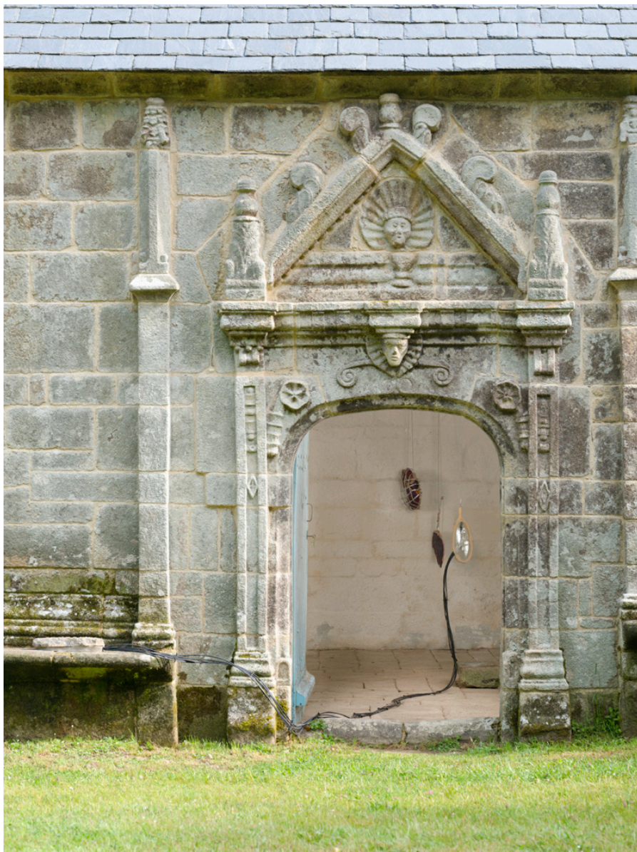
Lampe 1 Dimensions variables 2025