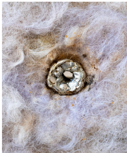
Les (2023) détail.