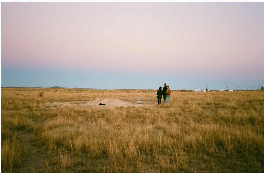
Objet Attaché#5 — Sand Kiln 550 x 270 x 140 cm 2019

Cette pièce fait partie de la série de sculptures/fours intitulée Objets attachés . Réalisée en collaboration avec Luca Guizzo lors d'une résidence à Marfa, Sand Kiln est le premier des objets attachés dans lequel il est possible d'entrer.