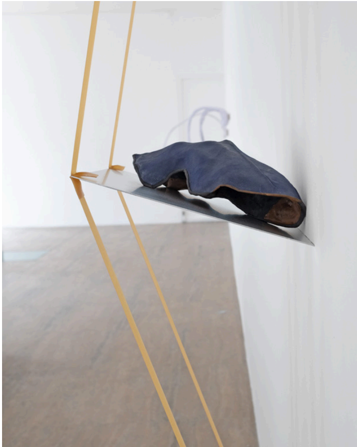
Knee , 280 x 41 x 40 cm 2023