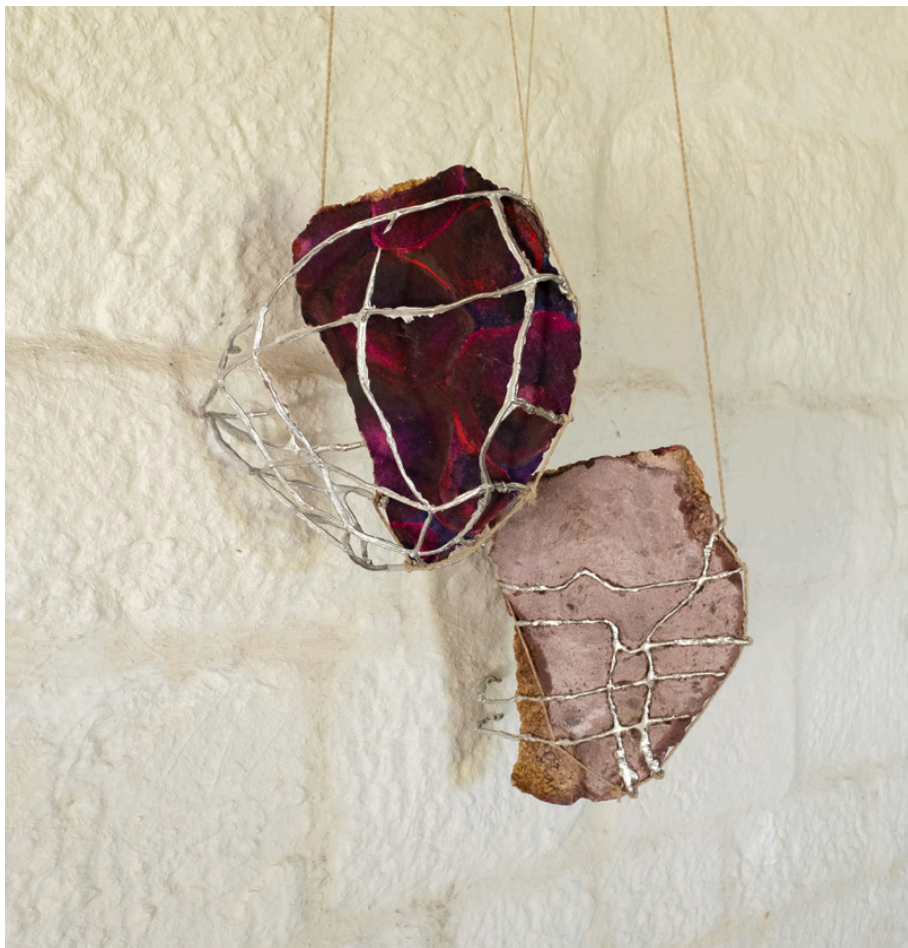
Une peinture de mûre 34 x 32 cm x hauteur variable 2025