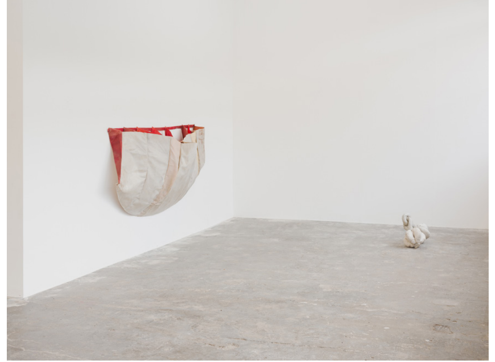
Vues d'ensemble de l'exposition A suspicious lack of purple à Smallville, Neuchâtel (CH)