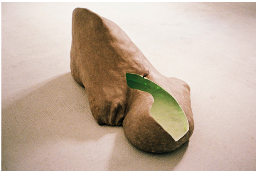
Sea lion foot 98 x 60 x 72 cm 2016

D'un certain point de vue c'est un pied à l'orteil exagérément gros, d'un autre une otarie. Son intérieur enduit de pigment phosphorescent se charge quand il fait jour et luit dans la pénombre, quand la lumière s'éteint.