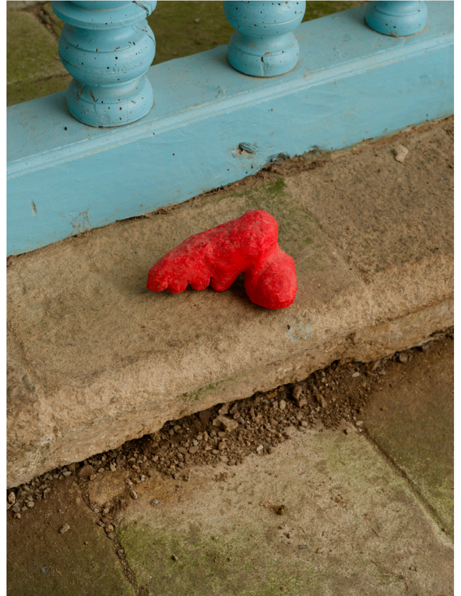
CIRE D'ABEILLE, PIGMENTS.