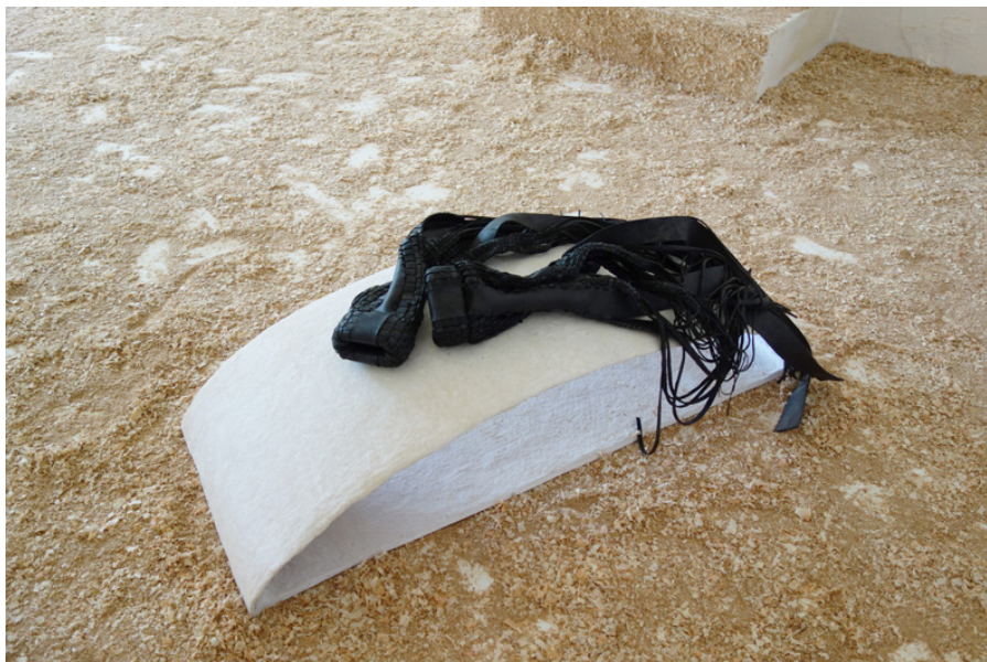
Gants 96 x 43 x 38 cm 2020

Cette pièce et Armure ont été présentées lors d'un duo show avec Sarah Holveck. Pour lire le texte et voir plus d'images de l'exposition http://paulineperplexe.com/ingrid.html