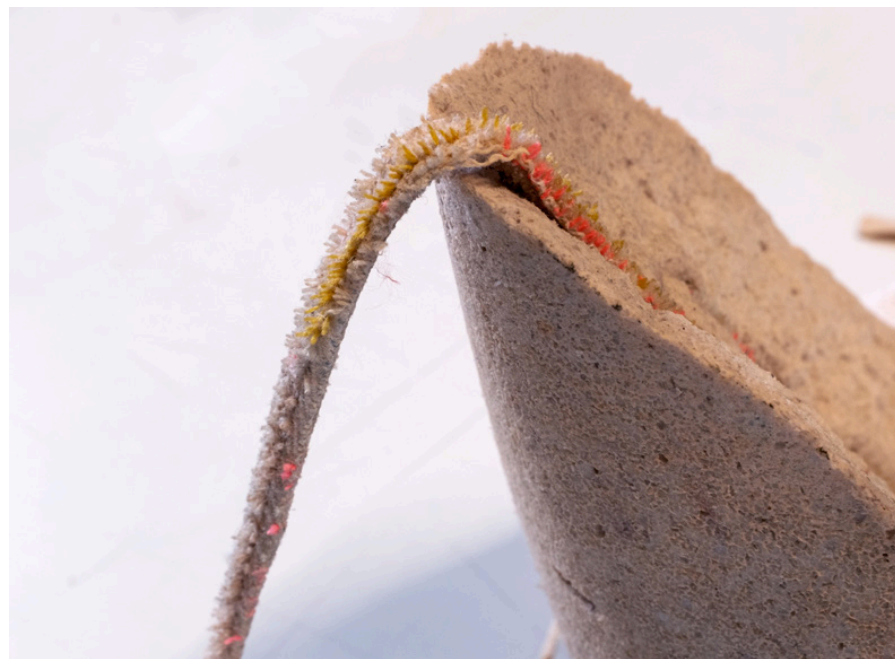
Bread on cake en collaboration avec Luca Guizzo 47 x 29 x 31 cm 2024

PÂTE À SEL CRUE, POUDRE DE MARBRE ROSE, CARTON DE RENFORT, TOILE DE COTON, FILS POLYESTHER, BÉTON.