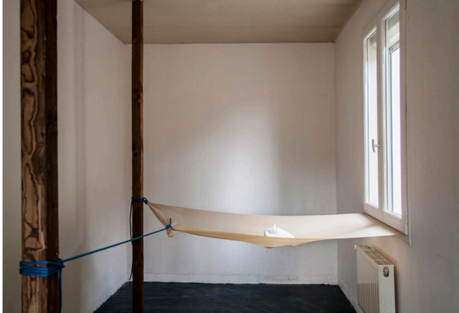
Osselet 320 x 390 x 110 cm 2015