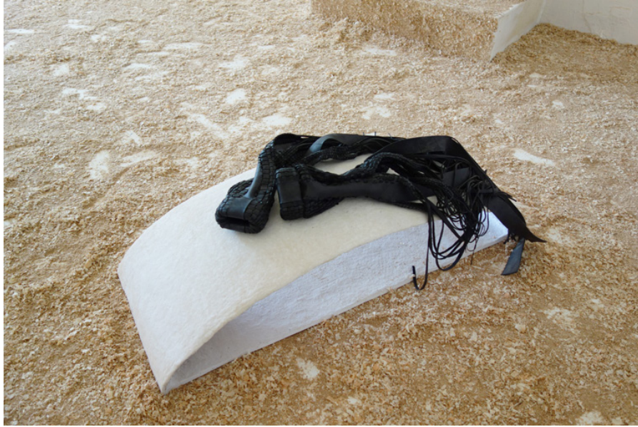
Gants 96 x 43 x 38 cm 2020

Cette pièce et Armure ont été présentées lors d'un duo show avec Sarah Holveck. Pour lire le texte et voir plus d'images de l'exposition http://paulineperplexe.com/ingrid.html