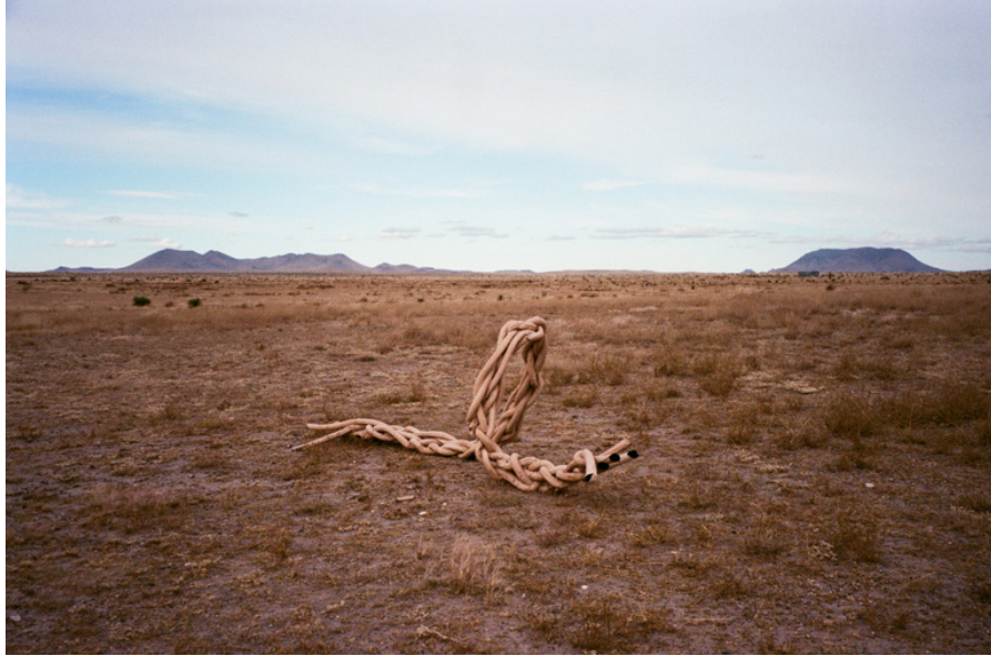
Test 410 x 120 x 27 cm 2019

Pour réaliser cette pièce, des tubes de tissu gonflés de ballons allongés sont enduits d'un mélange d'argiles puis tressés. Une fois sèche, la forme creuse, solide et légère vacille sous les vents forts du désert. Il suffit de plonger la forme dans l'eau pour la débarasser de sa coque structurante. Pièce réalisée en collaboration avec Luca Guizzo.