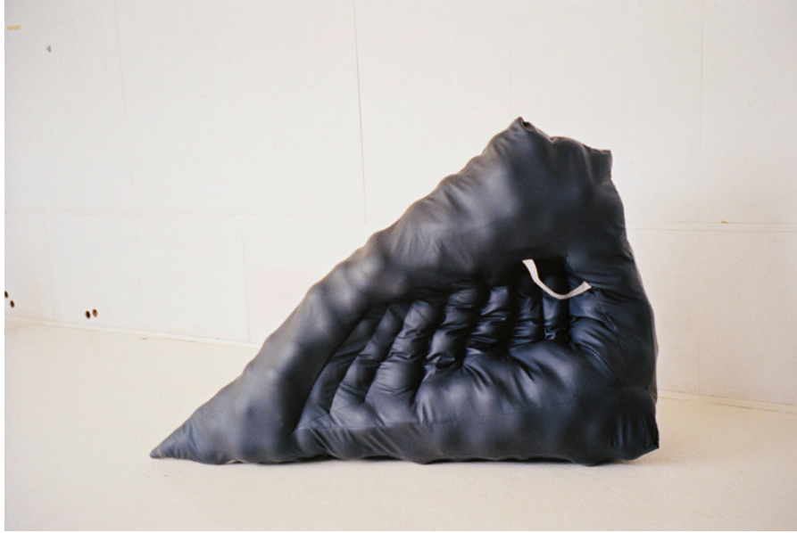
Tout les spécialistes du sujet ont disparus 148 x 259 x 83 cm 2017

Un canot gonflable à poignée, une combinaison de survie — débarrassé des spécialistes on sait finalement mieux à quoi s'en tenir. Sauf quand il s'agit d'assurer l'étanchéité à l'air.