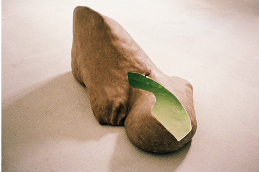
Sea lion foot 98 x 60 x 72 cm 2016

D'un certain point de vue c'est un pied à l'orteil exagérément gros, d'un autre une otarie. Son intérieur enduit de pigment phosphorescent se charge quand il fait jour et luit dans la pénombre, quand la lumière s'éteint.