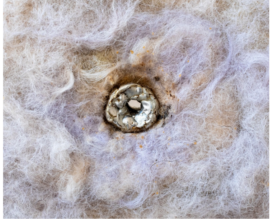
Les (2023) détail.