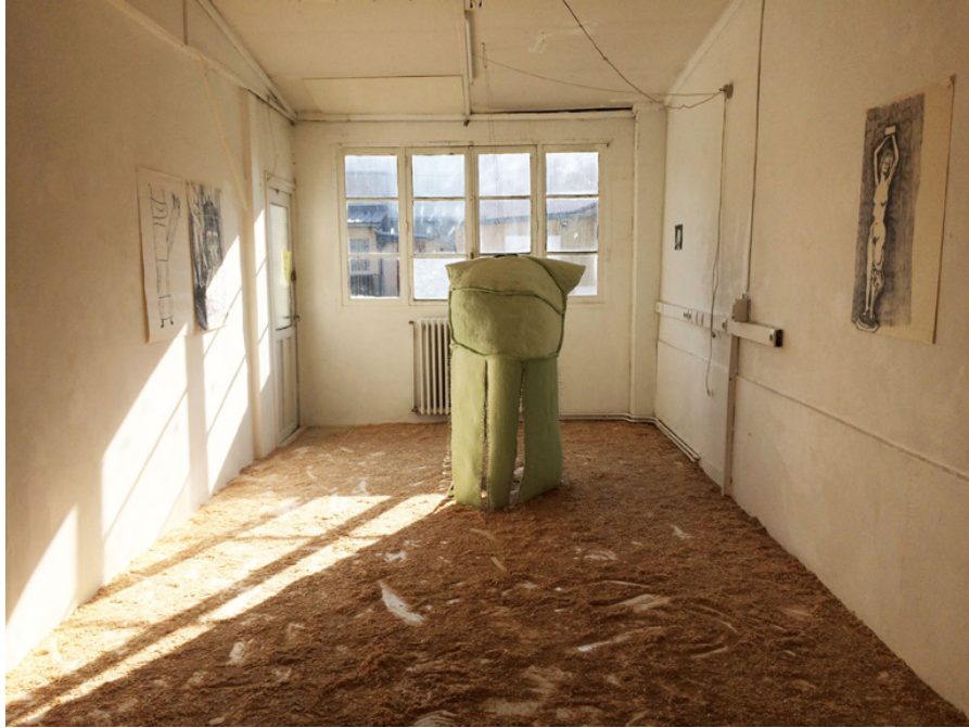
Armure 180 x 122 x 109 cm 2020

La pâte à papier est imbibée de gomme arabique puis appliquée sur le velours qui crisper en séchant. Cette sculpture est aussi une armure qui sera associée au personnage de Jeanne d'Arc dans un film réalisé par la vidéaste Gaëlle Cognée.