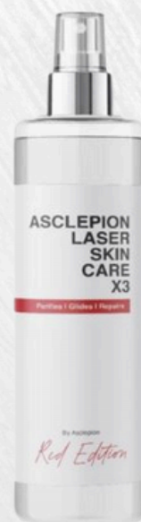
Spay Laser Skin Care