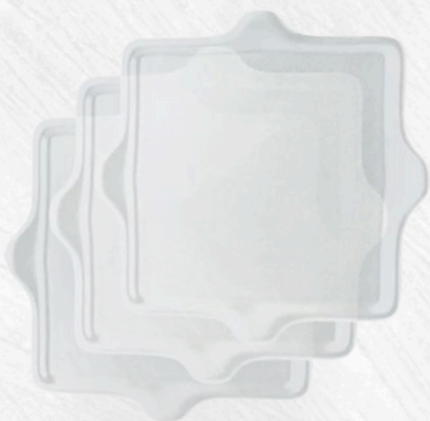
Protection hygiène 100 pièces