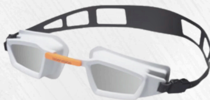
Lunettes clients en silicone pour laser