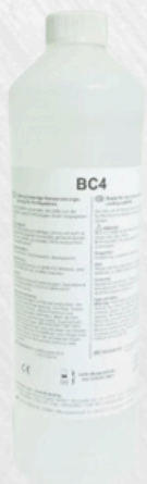
Liquide froid BC4