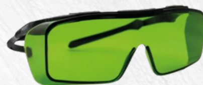
Lunettes opérateurs laser Epilab