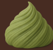
Chocolate Dubai sin azúcar