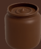
Salsa de chocolate sin azúcar