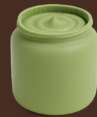
Salsa de pistacho y chocolate blanco sin azúcar