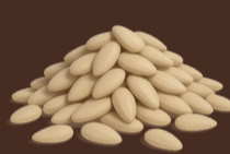
Semillas de girasol