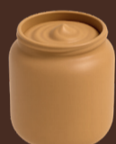
Crema de cacauet 100%