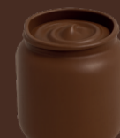
Salsa de xocolata sense sucre