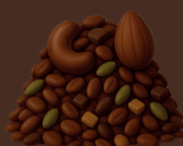
Granola de cacau