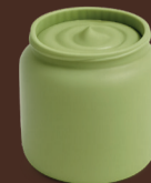
Salsa de festuc i xocolata blanca sense sucre