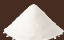
Llet en pols