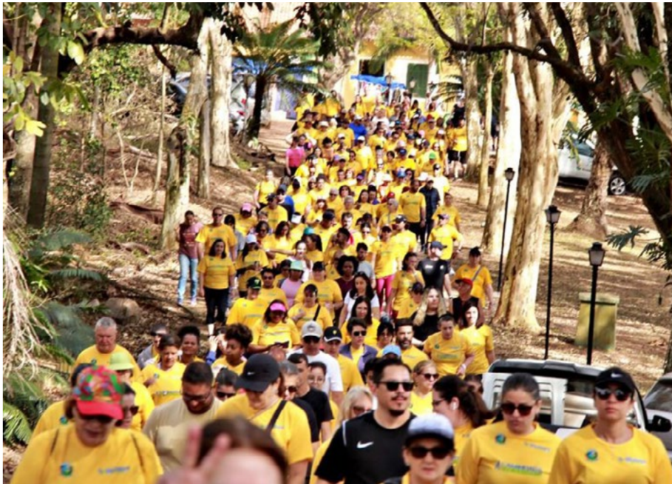
ROTA VERDE Caminhada reuniu 332 participantes no Clube de Campo Vale Verde, em Valinhos. Mais de 700 itens de higiene pessoal foram arrecadados e enviados ao Fundo Social.