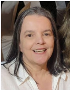
Genigleide da Hora

Foco, um objetivo pra alcançar. Força, pra nunca desistir de lutar e fé, pra me manter de pé. Projota (Foco, Força e Fé)