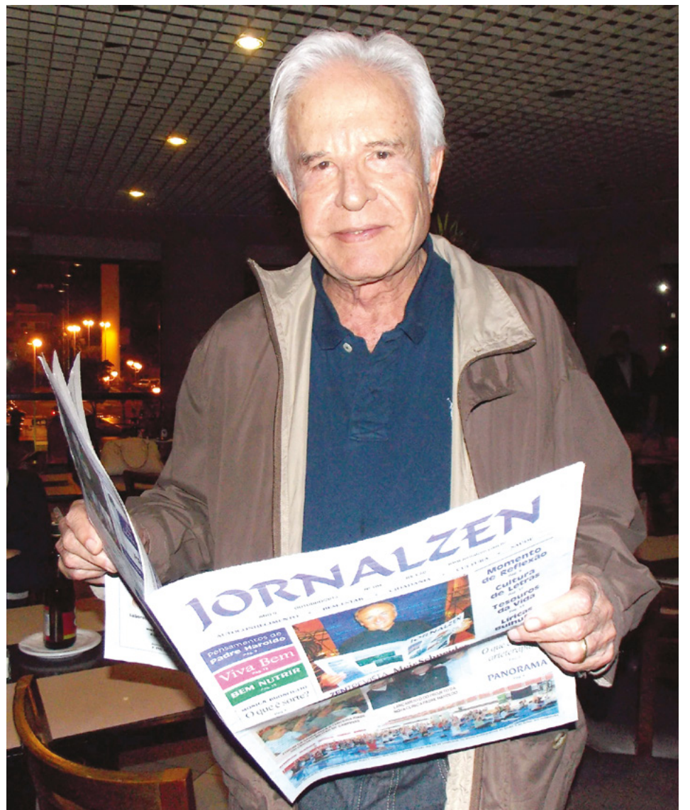
Marcelo Tas (ao alto) e Cid Moreira (acima) conhecem o JORNALZEN durante entrevistas ao jornal, a exemplo do filósofo e escritor Mario Sergio Cortella e dos cantores Toquinho e Elba Ramalho (à esquerda)