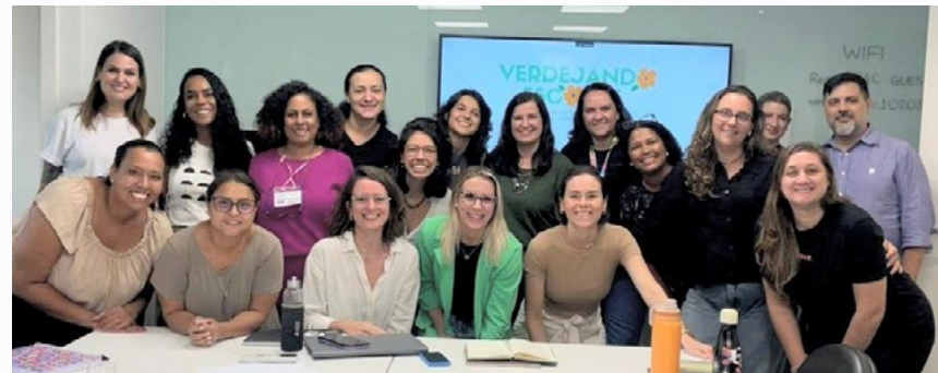
Representantes das instituições responsáveis pela execução da 2ª edição do projeto "Verdejando Escolas", que consiste em transformar os locais de aprendizagem em ambientes que promovam contato direto com a natureza