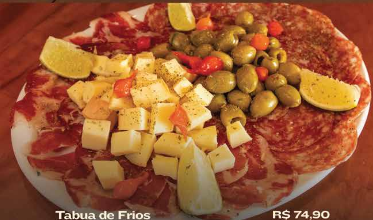
Tabua de Frios

Salame italiano, Presunto Copa, Queijo Gorgonzola e Azeitonas preta azapa. Acompanha cesta de pão. 👤+