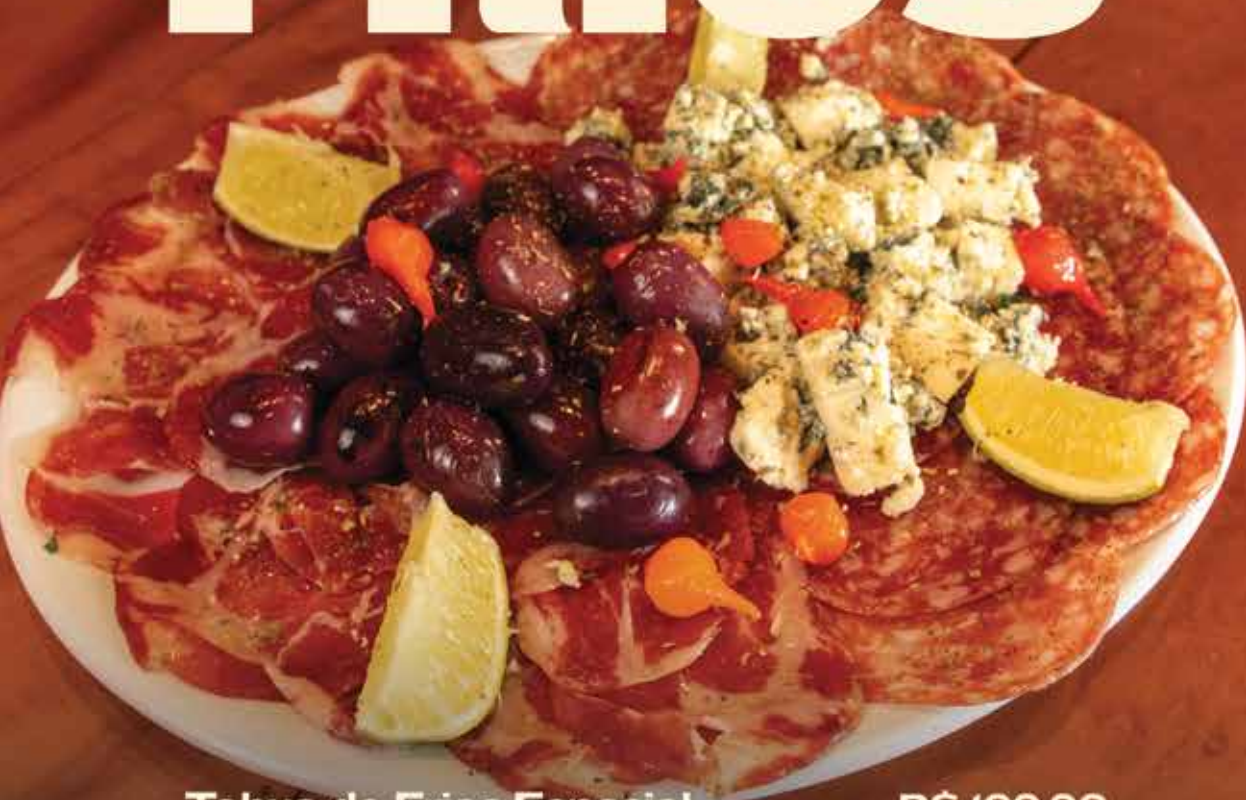
Tabua de Frios Especial