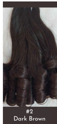
#2 Dark Brown