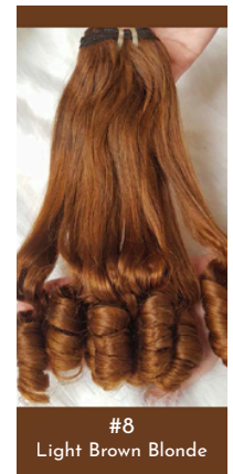
#8 Light Brown Blonde