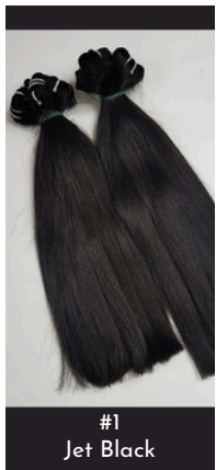
#1 Jet Black

Du Noir Naturel au Blond Platine (#613), nous utilisons un processus de coloration doux pour préserver la santé et la vitalité du cheveu.