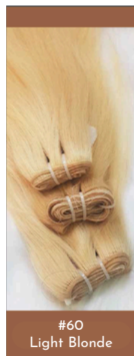
#60 Light Blonde