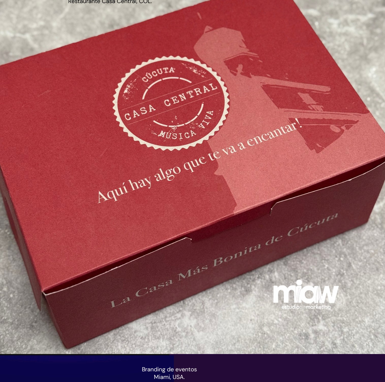
Delivery Box. Restaurante Casa Central, COL.