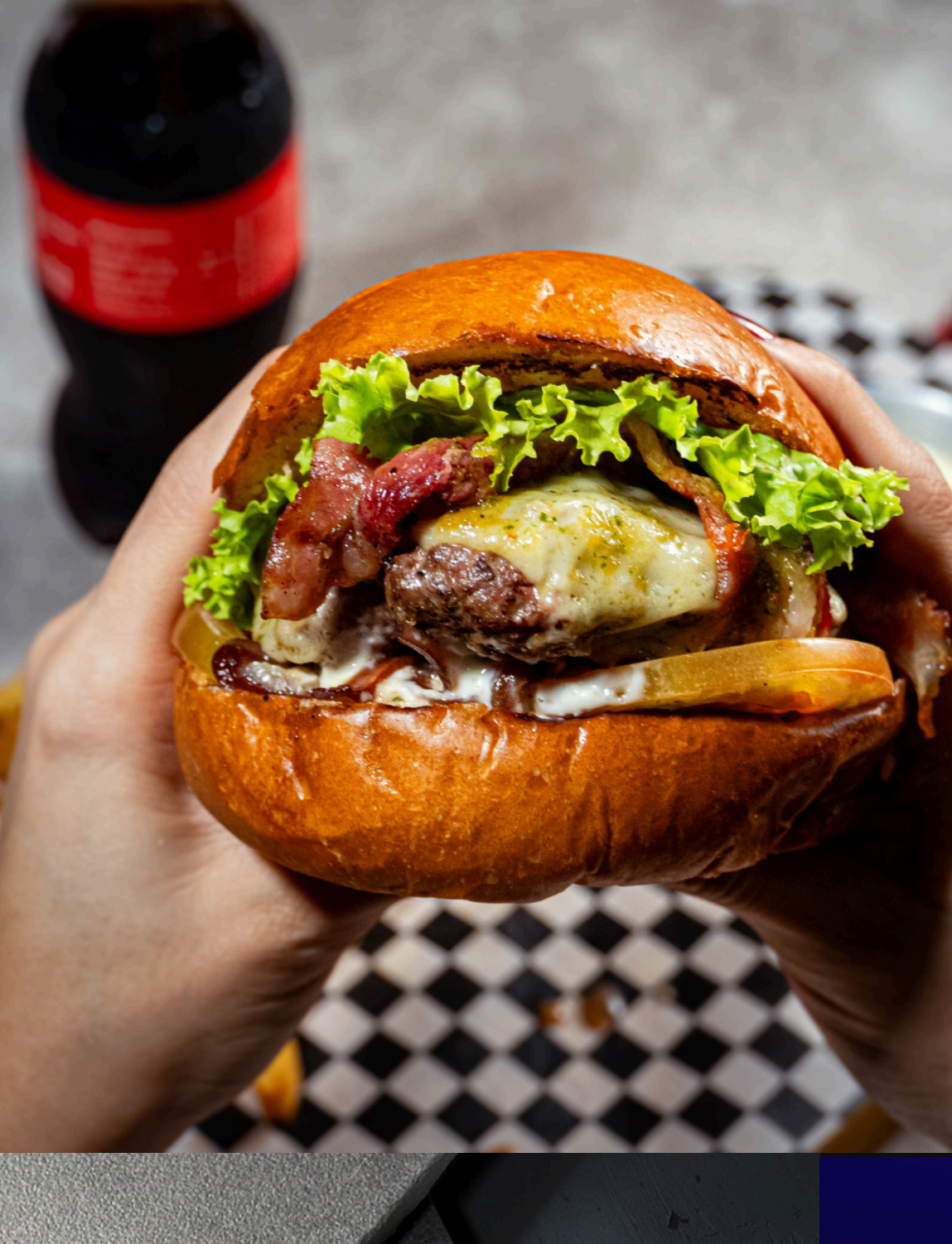
Fotografía. Restaurante Casa Central, COL.