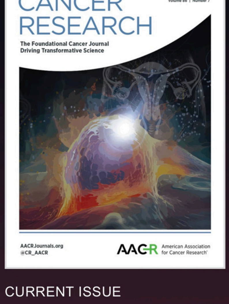
Diseño portada la revista científica Cancer research, USA. Imagen creada para Schwarz Lab, WashU, St. Louis, USA.