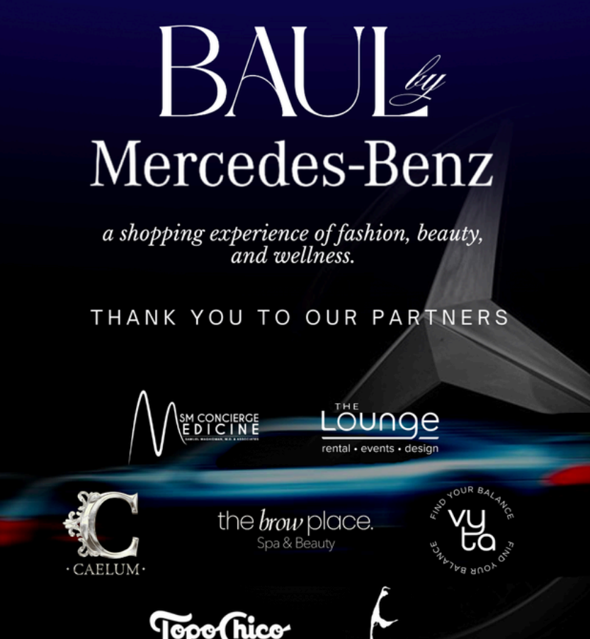
Branding de eventos Miami, USA.