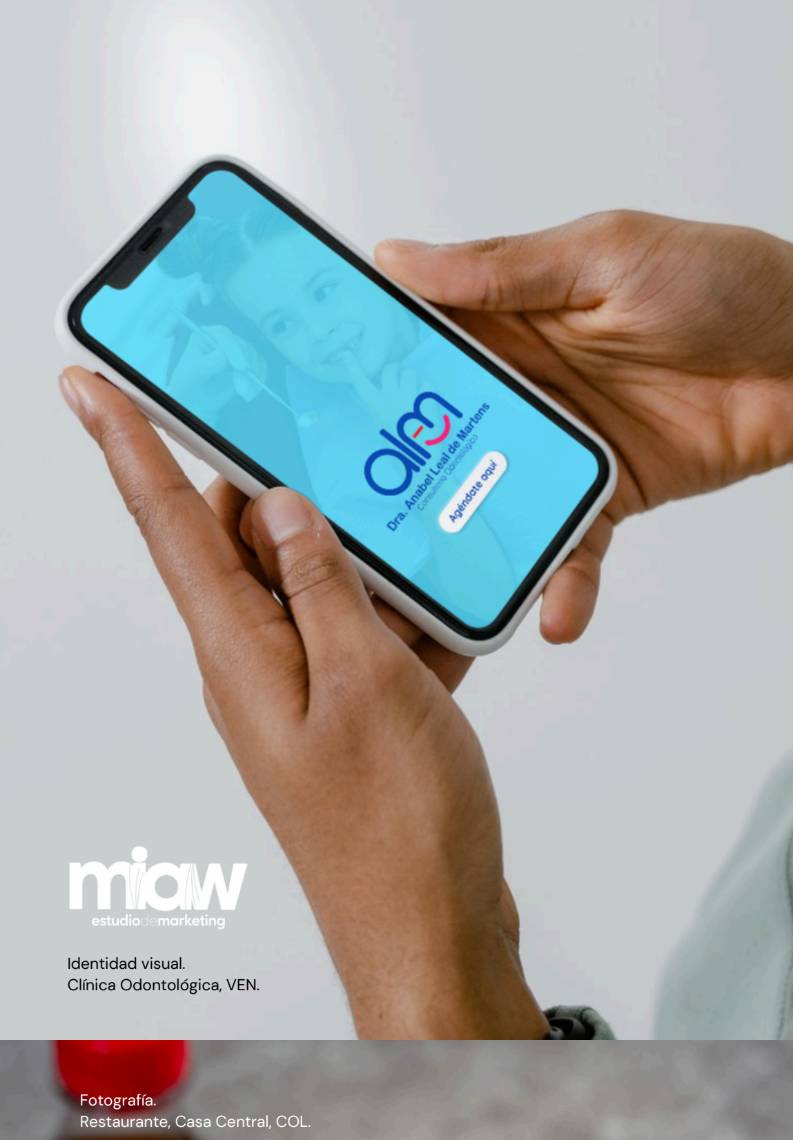
Identidad visual. Clínica Odontológica, VEN.

Why Immuniq? At Immuniq Analytics, we specialize in generating complete biological data via personalized insights, focusing on immunology, oncology, and cellular biology.