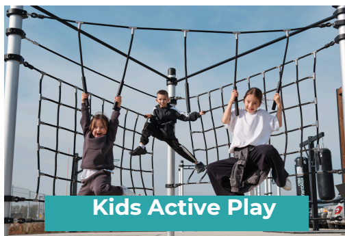
Kids Active Play