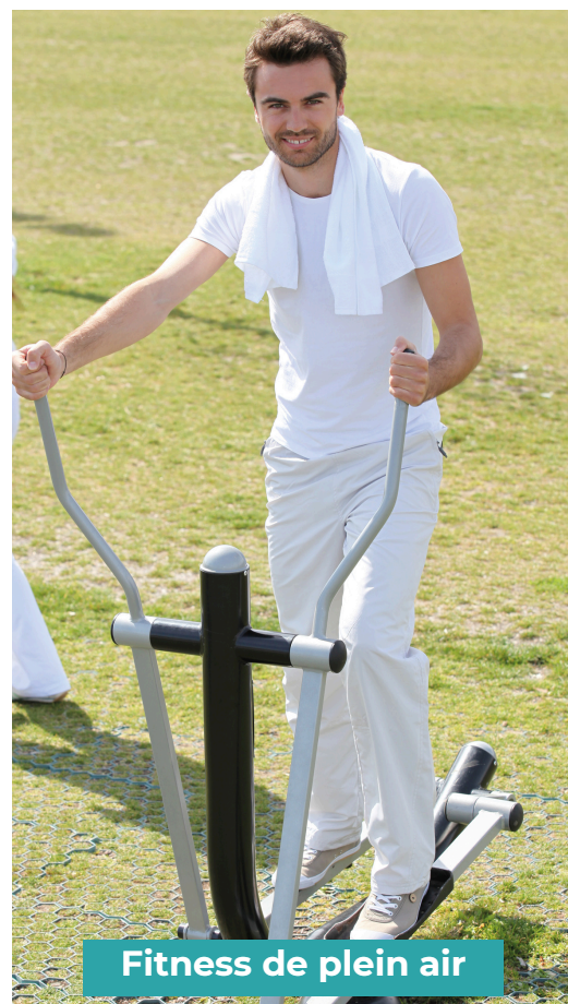
Fitness de plein air

Un projet ? Une approche sur mesure Kenguru Pro !