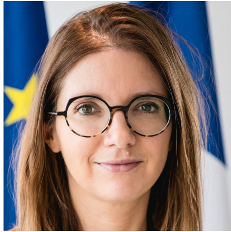
AURORE BERGÉ Ministre des Solidarités et des Familles