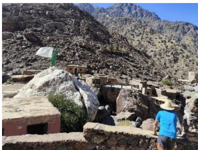
VISTES DE CHAMAROUCH, I L'EQUIP DEL RESTAURANT

Una vegada allí, al restaurant Hanafi, vos espera un suc de taronja acabat d'esprèmer i un dinar típic en un espai amb una atmosfera única i unes vistes privilegiades. ( dinar inclòs )