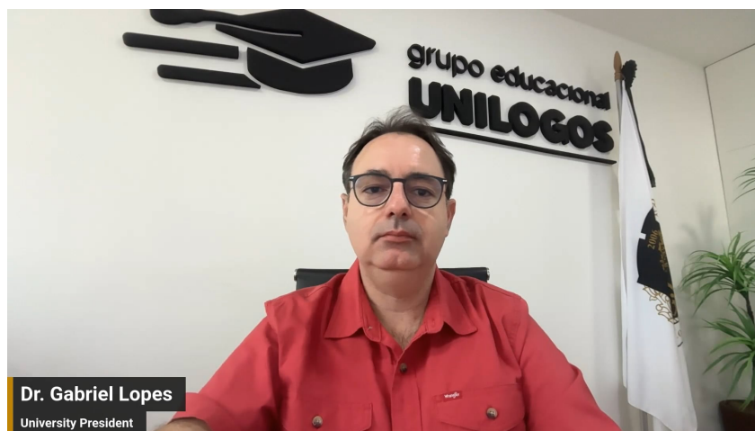
Video - Instruções para Examinadores Externos ( clique para assistir )

A participação de examinadores externos, nacionais ou internacionais, é admitida e incentivada como mecanismo de pluralização acadêmica e fortalecimento institucional. Contudo, sua atuação depende de acesso prévio, obrigatório e comprovado aos regulamentos, manuais, baremas, diretrizes metodológicas e normas acadêmicas da UniLogos. Sem esse conhecimento prévio, não há base legítima para atuação avaliativa compatível com o sistema institucional.