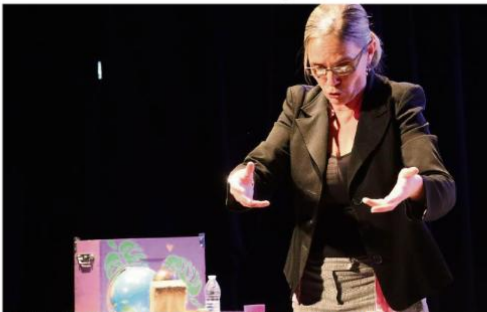
La Mère Lapid en plein cours, dressant un parallèle entre abeilles et humains.

« Hilarant, décoiffant, instructif » : c'est ce qu'annonçait l'affiche.