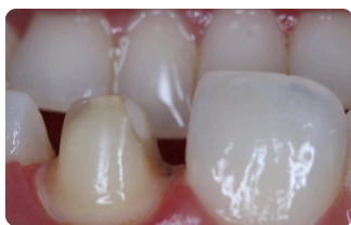
ANTES DA CORREÇÃO