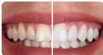
EXEMPLO DA CORREÇÃO DE COR