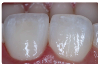
APÓS A CORREÇÃO