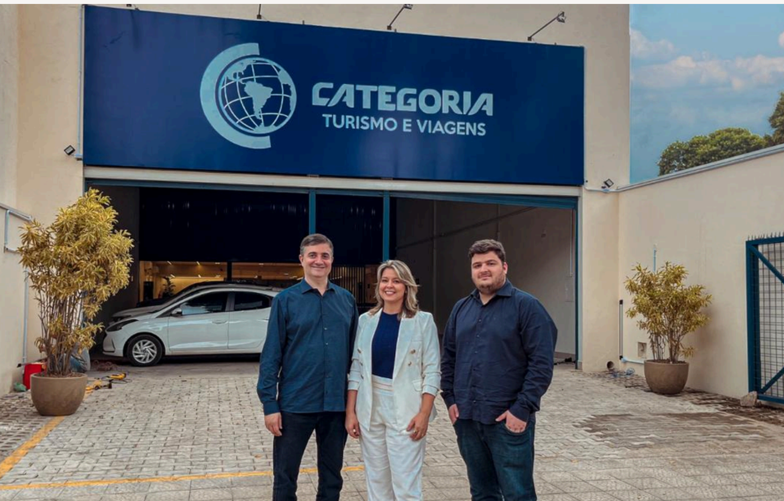
Foto dos diretores da Categoria Turismo em frente à sede física da empresa.

Desde a saída do Brasil, um representante da Categoria Turismo / Tour Leader estará com você, acompanhando todos os momentos da viagem. Além disso, em cada destino haverá um guia local para enriquecer os passeios e auxiliar em todas as experiências.