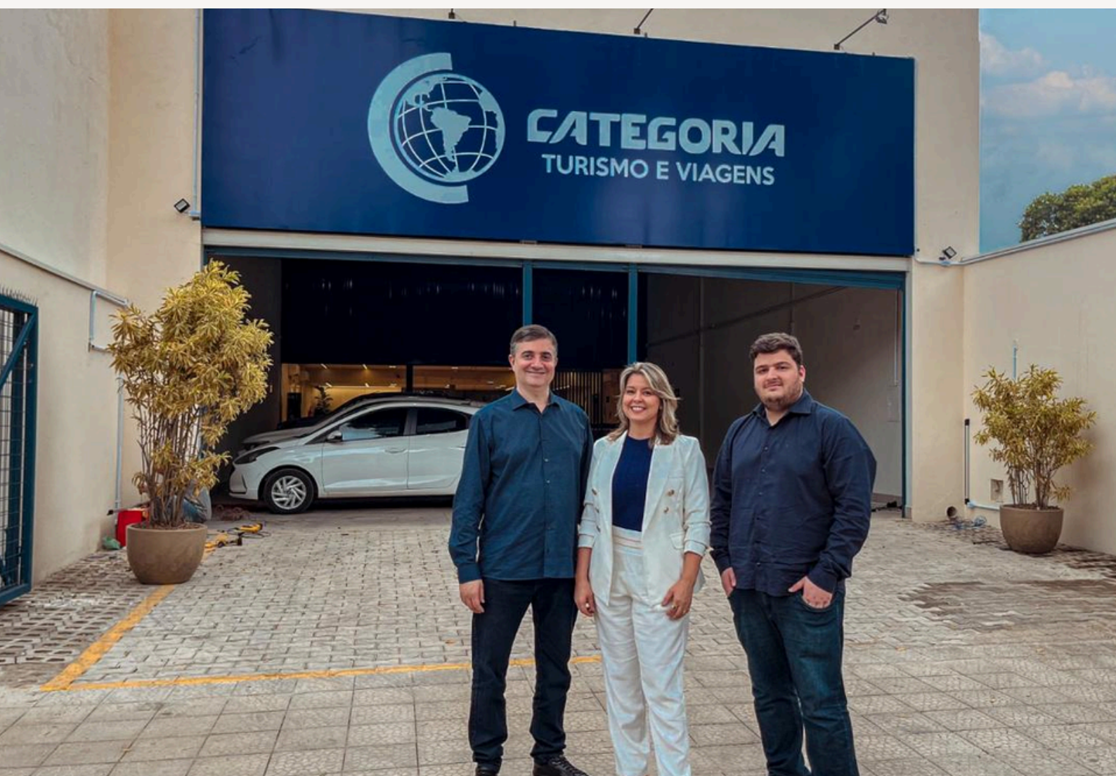
Foto dos diretores da Categoria Turismo em frente à sede física da empresa.

Um representante da Categoria Turismo acompanhará o grupo desde a saída do Brasil, garantindo suporte e assistência durante toda a viagem.