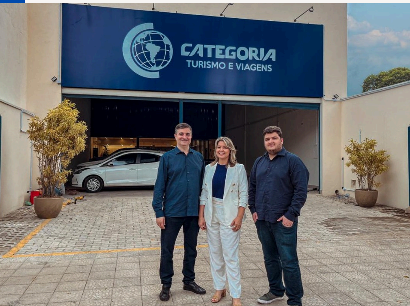
Foto dos diretores da Categoria Turismo em frente à sede física da empresa.

Além de um representante da Categoria Turismo desde a saída do Brasil, um guia que fala português irá acompanhá-los nesta viagem.