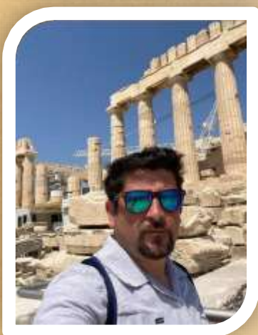
SOCIO FUNDADOR TOUR ACOMPAÑANTE PROYECT MANAGER