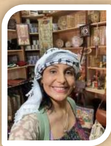
SOCIO FUNDADOR TOUR ACOMPAÑANTE ING. ADM EMPRESA