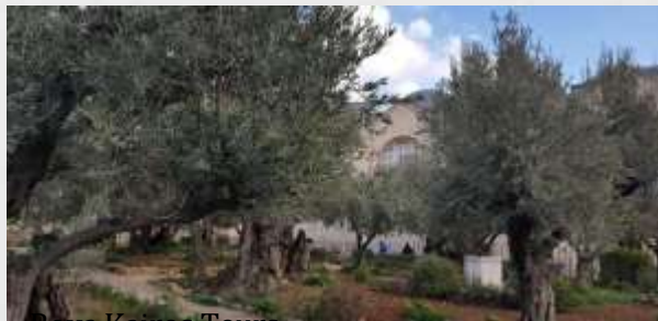
Roya Kairos Tours