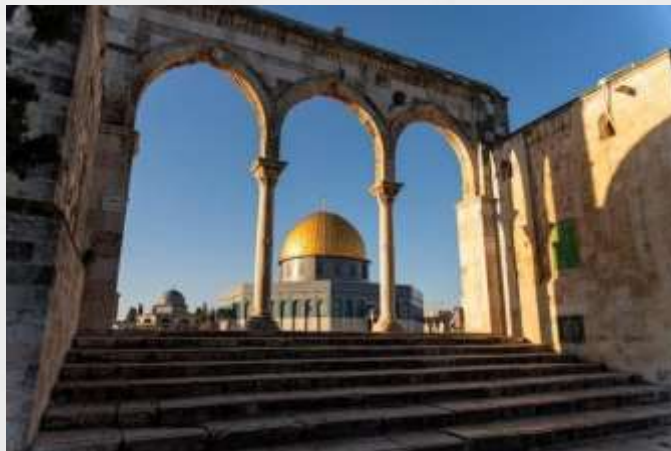
Roya Kairos Tours

Desayuno. ¡Descubre la magia y los secretos de Jerusalén como nunca antes! Este será nuestro último día y lo disfrutaremos al máximo. Comenzaremos nuestro recorrido visitando la explanada del templo o también conocido como el Monte Moriah. El Monte del Templo es el sitio judío más sagrado de la Tierra, ya que fue allí donde estuvo el Templo y donde Abraham se preparó para ofrecer a su hijo Isaac como sacrificio, actualmente se encuentra el Domo de la Roca. Posteriormente visitaremos el sitio más sagrado del Judaísmo, el muro de los lamentos. Aquí podremos vislumbrar la energía espiritual de mucha gente que viene a orar en este sitio de diferentes partes