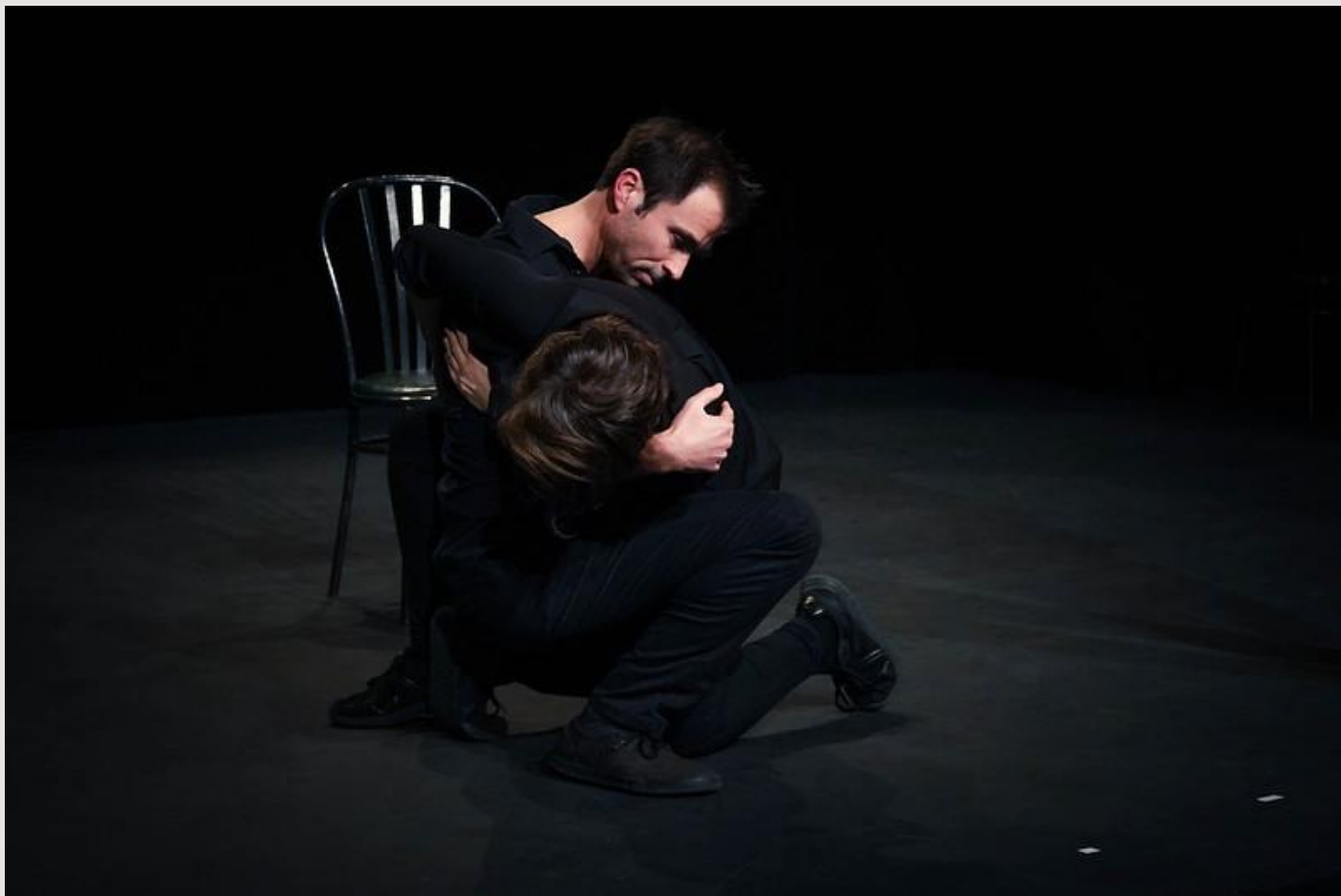
Première représentation en janvier 2020 lors du festival Les 12h de l'impro organisé par la Bulle Carrée