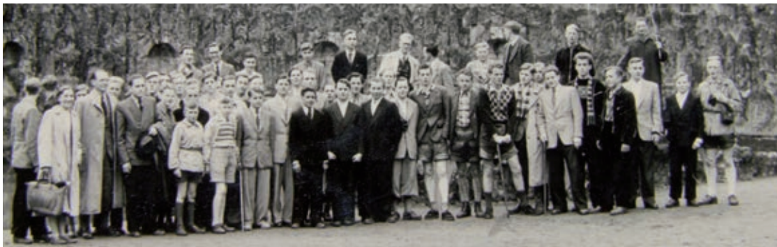
Betriebsausflug der Bosch-Lehrlinge 1954 nach Kassel

Von 1960 bis 1962 war er im Predigerseminar von St. Michael. Bei einem späteren Besuch in St. Michael trafen wir uns zufällig und er stellte mir seine Frau vor, die aus dem Alten Markt stammte. Seine Frau hat den Bombenangriff am 22. März 1945 in