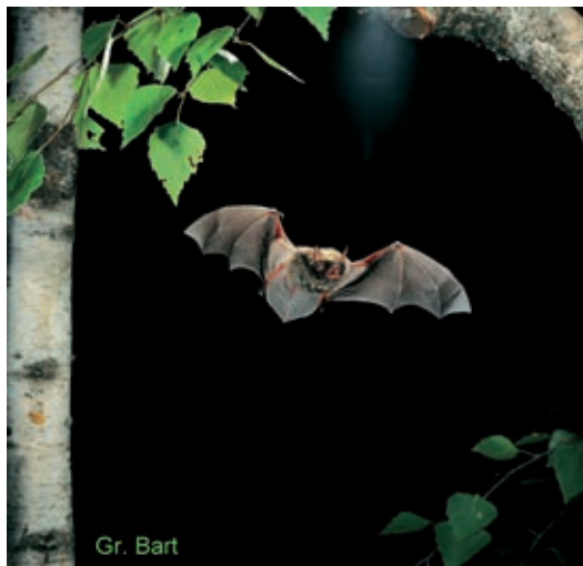
Foto: Große Bartfledermaus