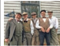
Am Nachmittag ab 15 Uhr lädt das Liebesgrund-Quartett auf dem Vinzenz-Fest mit Schlagern und Chansons zum Mitschwingen und Dahinschmelzen ein.

Das Vinzenz-Fest findet am Samstag, 16. September von 11 bis 18 Uhr am Mutterhaus der Vinzentinerinnen Hildesheim statt, Hückedahl 10, 31134 Hildesheim. Der Eintritt ist frei. Um Spenden für die sozialen Einrichtungen der Vinzentinerinnen Hildesheim wird gebeten. Das Vinzenz-Fest ist Teil von „Rosen & Rüben 2023“.