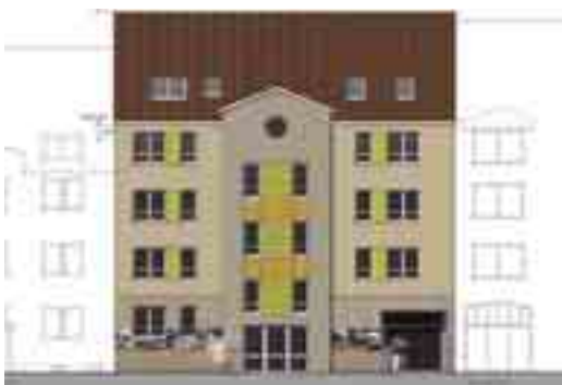
Geplante Vor- und Rückfassaden des Neubaus Alter Markt 22

Planungswerkstatt im Michaelis-Quartier am 29. September 2010, 9.00 bis 16.00 Uhr 15.30 Uhr Präsentation der Ergebnisse Ort: Grundschule Pfaffenstieg