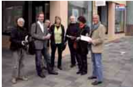
Rundgang mit interessierten Hauseigentümern und Bewohnern

Interessierte Bewohner und Grundstückseigentümer aus dem Stadtteil und Mitglieder der Eigentümerstandortgemeinschaft (ESG) haben gemeinsam mit dem Stadtumbaumanagement am 25. August 2010 einen Rundgang durch das Quartier gemacht, um der Frage nachzugehen, wie der Stadtteil in der Zukunft gestaltet werden könnte.