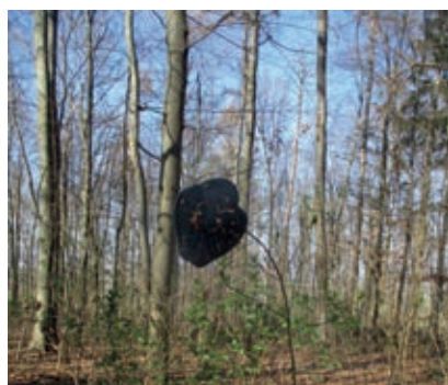
im Galgenberg

Und vielleicht sieht man irgendwann den Wald vor Mützen nicht. Wer hatte diesen schlaun Plan? Ob er Gewinn verspricht?