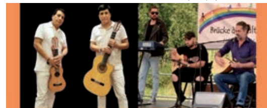
(Text und Foto: Auszüge aus der Programmvorschau)

es Michaelisquartier im Ost-Innenstädter mit dabei. Vielen Dank!