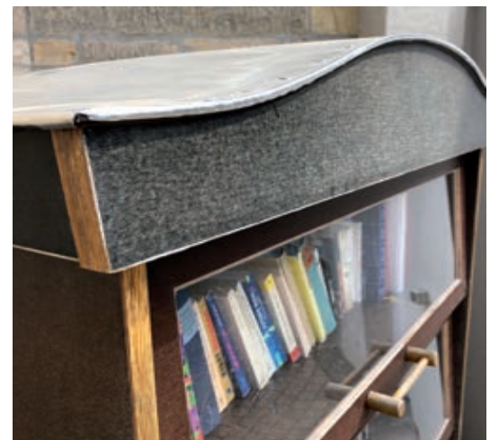
(Text und Foto: Irmgard Kiene)

Es findet reger Austausch der „Schätze“ statt und die Bestände werden pfleglich behandelt. Sollte der Bücherschrank voll sein, können Sie Ihre Bücher auch gern bei Werner Scholz, Michaelisstraße 15 abgeben.