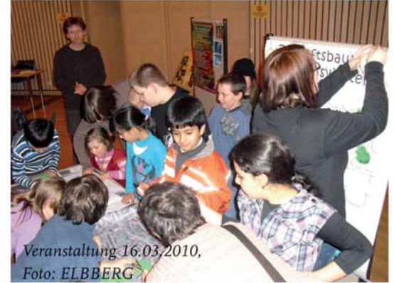
Veranstaltung 16.03.2010

Diese Seite in Ihrer Stadtteilzeitung soll Ihnen einen Überblick geben, was in Ihrem Stadtteil „los ist“ und welche Maßnahmen im Rahmen der Modernisierung Ihres Stadtteils diskutiert und in den nächsten Jahren umgesetzt werden sollen. Wir, das „Stadtumbaumanagement“ für das Michaelisviertel, wollen, dass Sie mitreden, Anregungen geben und - wenn Sie wollen - sich engagieren und einbringen. Diese Seite soll nun kontinuierlich erscheinen, um aus dem Viertel zu berichten. Haben Sie interessante Beiträge dazu, alte Fotografien oder Texte, Ideen zu Veranstaltungen? Gewerbetreibende können diese Seite auch gern zu Werbezwecken nutzen und damit zur Finanzierung beitragen.