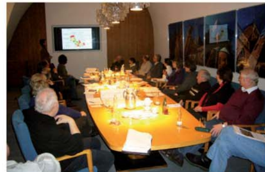
ESG-Werkstatt am 20. Januar 2010 im Alten Rathaus.

Ein attraktives Wohnumfeld, moderne und marktgängige Wohnungen, Spielmöglichkeiten für Groß und Klein sowie Gärten, Terrassen und Stellplätze in den Blockinnenbereichen. Der Weg dorthin führt über die Aktivierung und die engagierte Zusammenarbeit der Haus- und Grundeigentümer. Das Michaelis-Quartier ist insbesondere aufgrund seiner innenstadtnahen Lage mit vielfältigen Angeboten im unmittelbaren Umfeld ein Wohnstandort mit guten Entwicklungspotenzialen. Seit Anfang 2009 engagieren sich hier Eigentümer in einer „Eigentümerstandortgemeinschaft (ESG) Michaelis-Quartier“. Ihr Ziel ist eine Aufwertung des Quartiers und damit verbunden eine Stärkung der Wohnfunktion und Verbesserung der Vermietungssituation einzelner Immobilien.