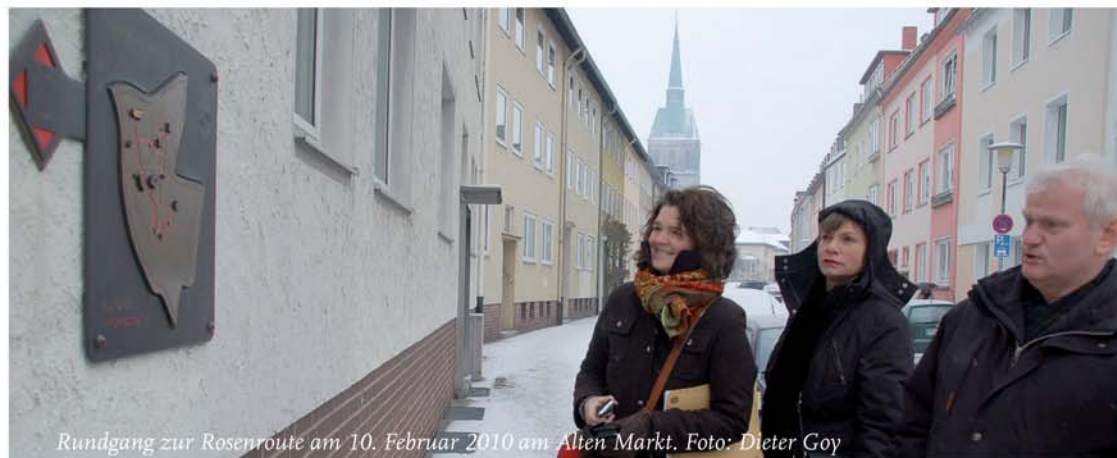
Rundgang zur Rosenroute am 10. Februar 2010 am Alten Markt.

Seit Anfang 2010 ist ein erweiterter Kreis von etwa 20 EigentümerInnen aktiv, die in bislang drei Werkstätten Konzeptideen zur Gestaltung der Straße Alter Markt und dessen Umfelds erarbeitet haben. Ausgehend von der Wiederbelebung der Rosenroute stehen spannende Themen wie Leben hinterm Haus, Grün- und Freiflächen, Fassadengestaltung und Modernisierung im aktuellen Handlungskonzept. „Auf den Quartiersrundgängen bei Schnee und Eis, um zu ermitteln, wo Rosen stehen und wo welche stehen könnten, und bei mehreren Treffen im Café.kom in der VHS hat sich eine engagierte Gemeinschaft ge-