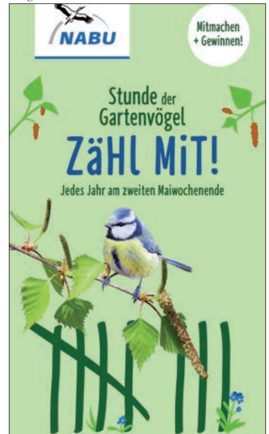
Text: Dieter Goy

Am Sonntag, 10. Mai ab 10 Uhr lädt der NABU zur Gartenvogel-Zählung im Magdalengarten ein. Macht Sinn und Spaß! Wir treffen uns beim Brunnen mitten im Garten, alle Gäste sind herzlich willkommen, auch spontan! Fernglas und Kamera sind ein gutes Hilfsmittel.