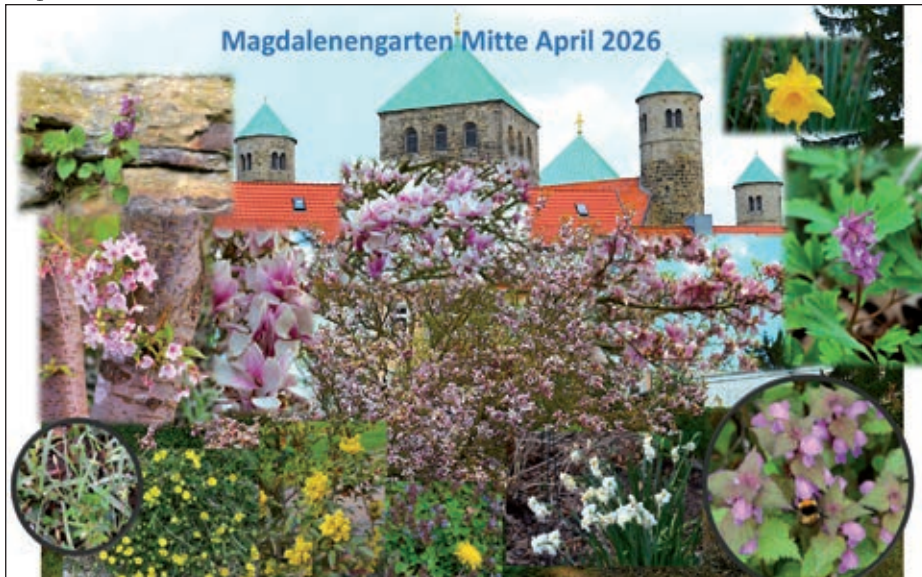
Text und Fotocollage: Dieter Goy

Die Sonne meint es gut, der Zaunkönig schmettert seine Begrüßung, rings herum blüht und summt es! Zentral glänzen natürlich die Magnolien, aber Narzissen, Veilchen, Taubnesseln, Lerchensporn, Fingerkraut und vieles mehr müssen sich nicht verstecken. Sogar ein paar wenige Wildtulpen sind zu sehen. Nicht zu vergessen: die weiße Blütenpracht an Weißdorn und Obstbäumen. Schöner Platz zum Verweilen!