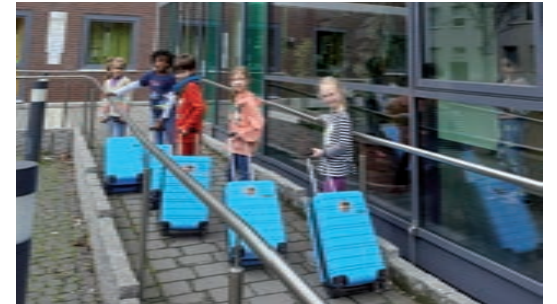
Text und Foto: Grit Schubert

Die Grundschule Alter Markt nimmt als eine von sieben Grundschulen im Bereich des Regionalen