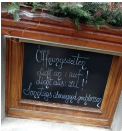
Gesehen an einem Lokal in der Jnnenstadt

Ist geöffnet oder nicht sieht man deutlich hier am Licht. Noch klarer kann man's wohl nicht sagen. Ein Blick genügt, gibt es noch Fragen?