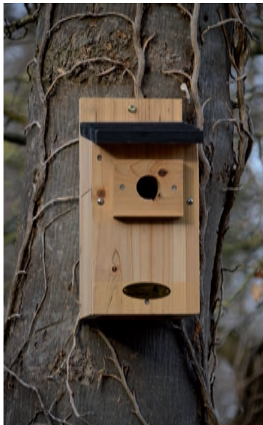
Nr. 2: Holzhaus für Meisen usw. im Magdalenengarten