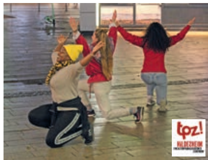
Tanzen in Gemeinschaft: Das interkulturelle Tanzprojekt „Dancen ohne Grenzen“ geht in die nächste Runde.

Ab dem 24. April soll „Dancen ohne Grenzen“ fortgesetzt werden. Bis einschließlich 26. Juni wird dann jeden Montag von 18.30 bis 21.30 Uhr im Seminarraum der Kulturfabrik Löseke geprobt. Darüber hinaus wird es am 3. und 4. Juni ein Probenwochenende geben. Die Ergebnisse sollen unter anderem bei den Hildesheimer Wallungen und dem Nordstadtfest im September präsentiert werden.