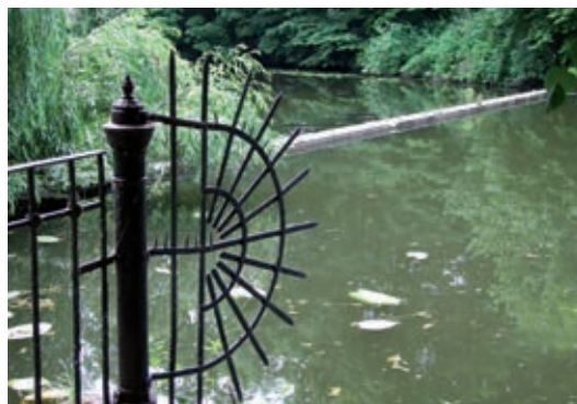
Graben in Bückeburg

Durch Unruhen und Kriege, bei denen Kanonen und Feuerwaffen zum Einsatz kamen, war eine weitere Veränderung der Stadtbefestigung erforderlich.