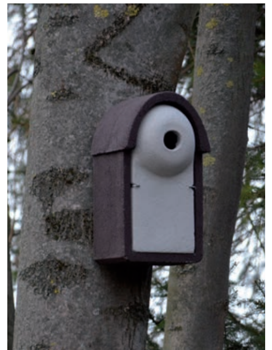
Nr. 3: Starenkasten aus Holzbeton im Magdalenengarten

Diese Sponsoren sind bei der Finanzierung der Doppelseite über da