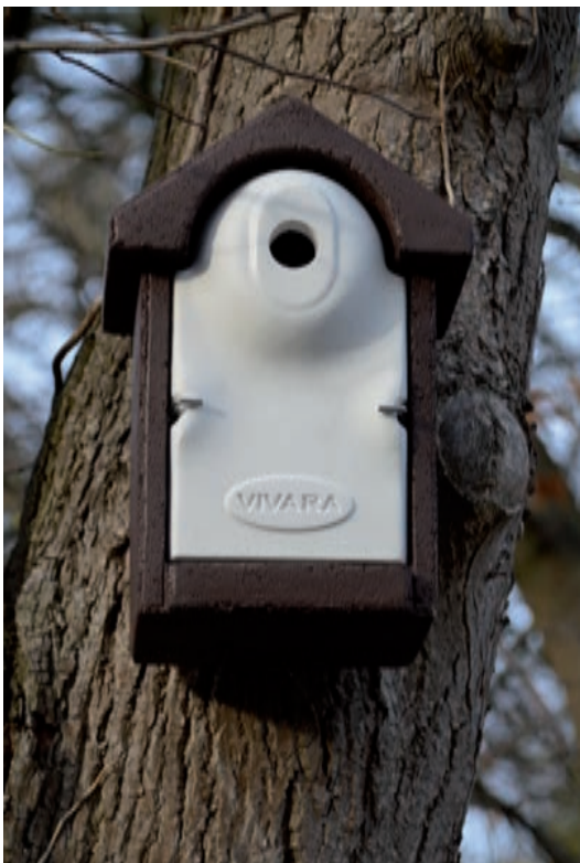
Nr. 1: Nisthöhle aus Holzbeton im Magdalenengarten