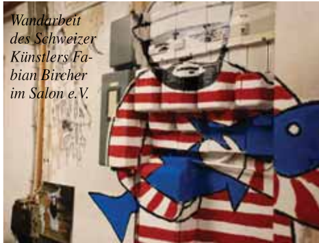
Wandarbeit des Schweizer Künstlers Fabian Bircher im Salon e.V.

„ mind the gap soll neugierig machen“ betont