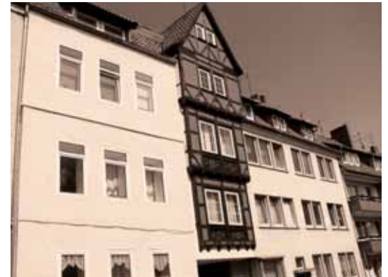
Gebäude vor der Sanierung

Wir freuen uns über die gelungene Sanierung der Fassade. Von Mietern und Nachbarn haben wir durchweg positive Rückmeldungen erhalten. Einige Passanten, mit denen wir ins Gespräch kamen, konnten sich mit der farblichen Gestaltung (Farbe Patina) anfangs nicht anfreunden und empfanden die Farbe als Fremdkörper. Zurzeit mag das stimmen, doch wir sind uns sicher, dass wenn andere Eigentümer nachziehen und den Mut haben sich bei der Farbgestaltung Hilfe von der Stadt zu holen, die Michaelisstraße eine würdige Verbindungsstraße von der Michaeliskirche zur Innenstadt wird.