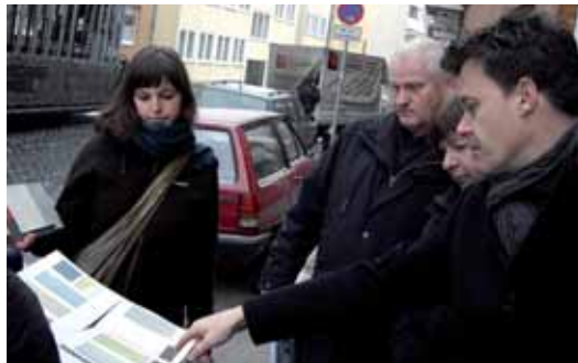
Auswahl der Farben

Seitdem die Stadt Hildesheim die Eigentümer Ende 2007 mit der Bitte zur Mitarbeit bei dem Projekt: „Gestalten Sie das Michaelisviertel mit!“ anscrieb, haben wir Interesse gezeigt und an mehreren Projektwerkstätten teilgenommen. Über das Städtebauförderprogramm „Stadtumbau West“ im Michaelisviertel waren wir durch diese Treffen informiert.