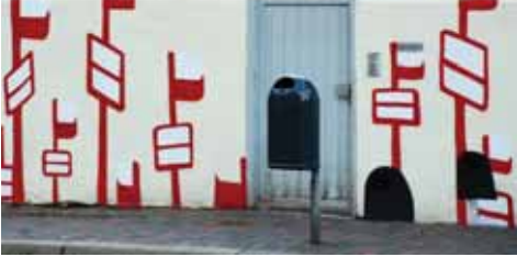
Wandarbeit des französischen Künstlers Paatrice an der Mauer der Bushaltestelle Moltkestraße

Wer in den letzten Wochen aufmerksam durch die Oststadt gegangen ist, konnte einige Veränderungen bemerken: Haltestellenschild, Mülleimer und Fußgängerampel an der Bushaltestelle Moltkestraße haben sich vervielfacht, ein Kiosk an der Einumer Straße trägt einen neuen Namen und auf grauen Stromverteilerkästen spielen sich skurrile Szenen ab.