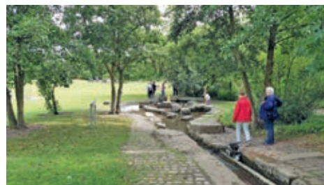
Ein schöner und großer Park gestaltet zum „Anfassen und Mitmachen“. Eintritt ko-

Im August besuchten wir eines der schönsten nachhaltigen Projekte der Expo 2000. Der Park der Sinne am südlichen Ende des Messegeländes ist ein besonderer Ort zum Entspannen, Genießen und Abschalten. Ausgedehnte Wiesen, Gartenlandschaften und Biotope, Teiche, Hügel, Felsen, ein Open-Air-Amphitheater, Irrgarten, Barfußpfad, Wasserspiele und Kunstobjekte mit Lerneffekt verbinden die vier Elemente Feuer, Wasser, Luft und Erde mit unseren fünf Sinnen – Riechen, Fühlen, Sehen, Hören und Schmecken.