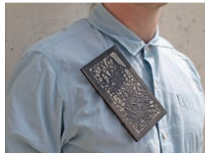
Mentoringprojekt Jonas Schwalenberg – Brosche Hineingeschaut

Das Projekt wurde unterstützt durch die Gleichstellung der HAWK-Hochschule für angewandte Wissenschaft und Kunst Hildesheim/Holzminde/Göttingen.