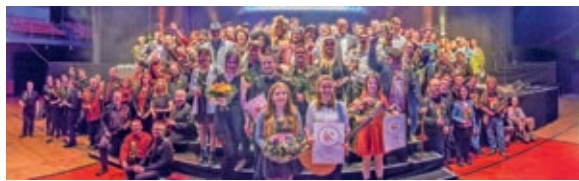
Glückliche Gewinner*innen nach dem hört!hört! Finale 2017

freut sich Schorrlepp, für die das Projekt eine Herzensangelegenheit ist. Über 1000 Zuhörer*innen und mitgereiste Fans waren jeweils bei den Finalveranstaltungen. Nun geht die Organisation für den dritten Wettbewerb wie-