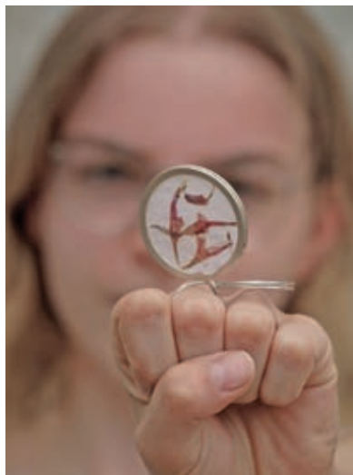
Mentoringprojekt Lena Schüler_ Ring – Die Reise eines Samens

Sehr verschieden haben sich die Mentoringteams ihren Forschungsfragen dialogisch angenähert und ebenso unterschiedlich äußerte sich jede individuelle formale und inhaltliche Auseinandersetzung in der Materialverwendung und der wechselseitigen Entwicklung von Tech-