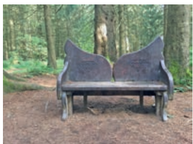
Projekt Mentoring Foto Flügelbank im Harz

In der Ausstellung „Seite an Seite“ werden die Ergebnisse aus dem gleichnamigen Semesterprojekt im Kompetenzfeld „Schmuck und körperbezogene Objekte“ der Fakultät Gestaltung an der HAWK gezeigt. Bachelorstudierende haben ein Semester lang in einem Mentoringprogramm mit ihren jeweiligen Mentorinnen zu einem individu-