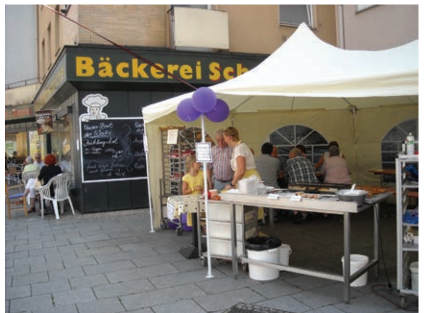
Bäckerei Schmidt lud wieder zum beliebten Tortenknobeln ein