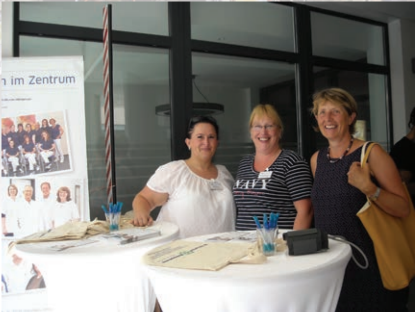
Auch im 2. Jahr wieder dabei – das Vincentinum