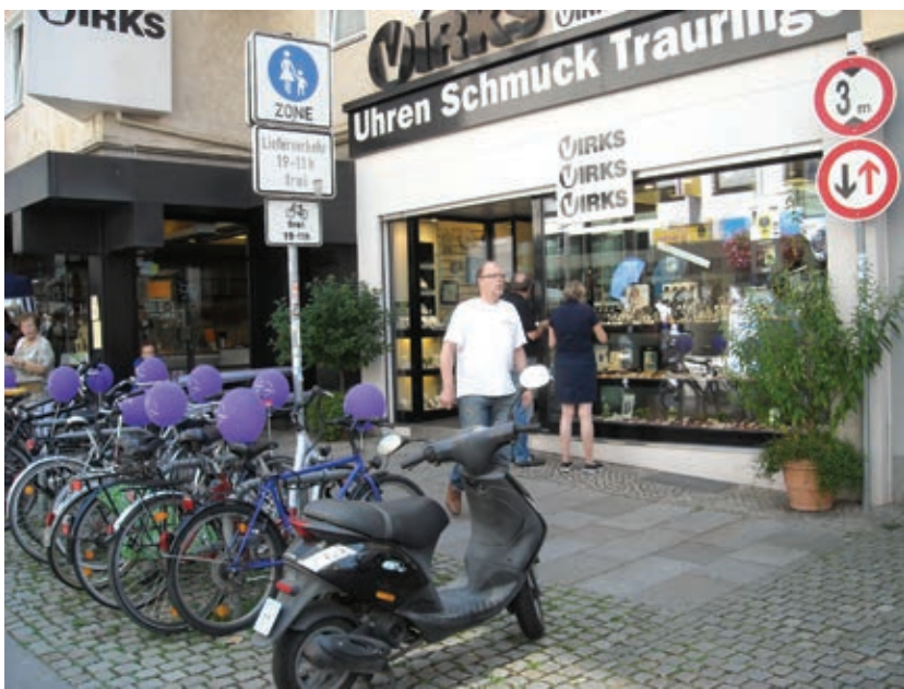
Uhren Schmuck Virks bot Rabatte auf Uhren der Marken „Citizen“ und „Jacques Lemans“