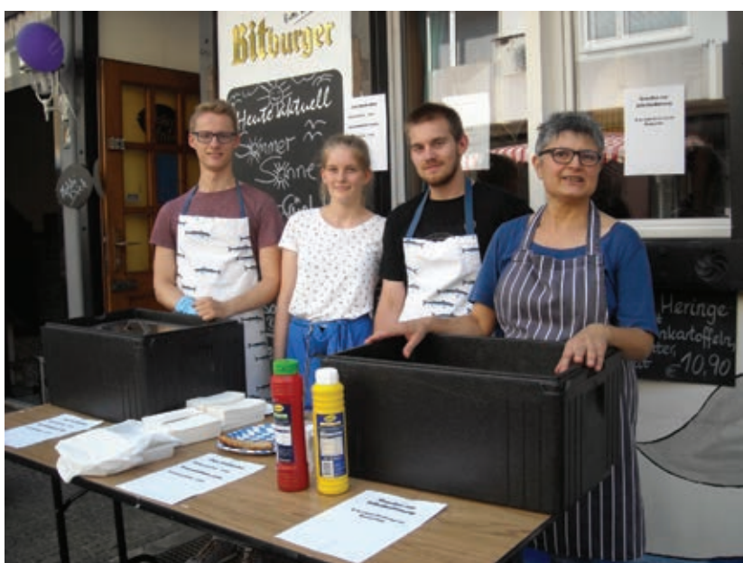
Das Team von Mobbi Dick

A m 4. August lud die Interessengemeinschaft Kurzer Hagen nun schon zum 9. Straßenfest ein, das trotz der hohen Temperaturen wieder sehr gut besucht war. Die vielfältigen Aktionen und Angebote sorgten bei den zahlreichen Besuchern für tolle Stimmung, die vielen Sitzgelegenheiten luden auch zum längeren Verweilen ein. Die Spenden des Straßenfestes kommen dieses Jahr dem Wildgatter und der Arnekenstiftung zu Gute.