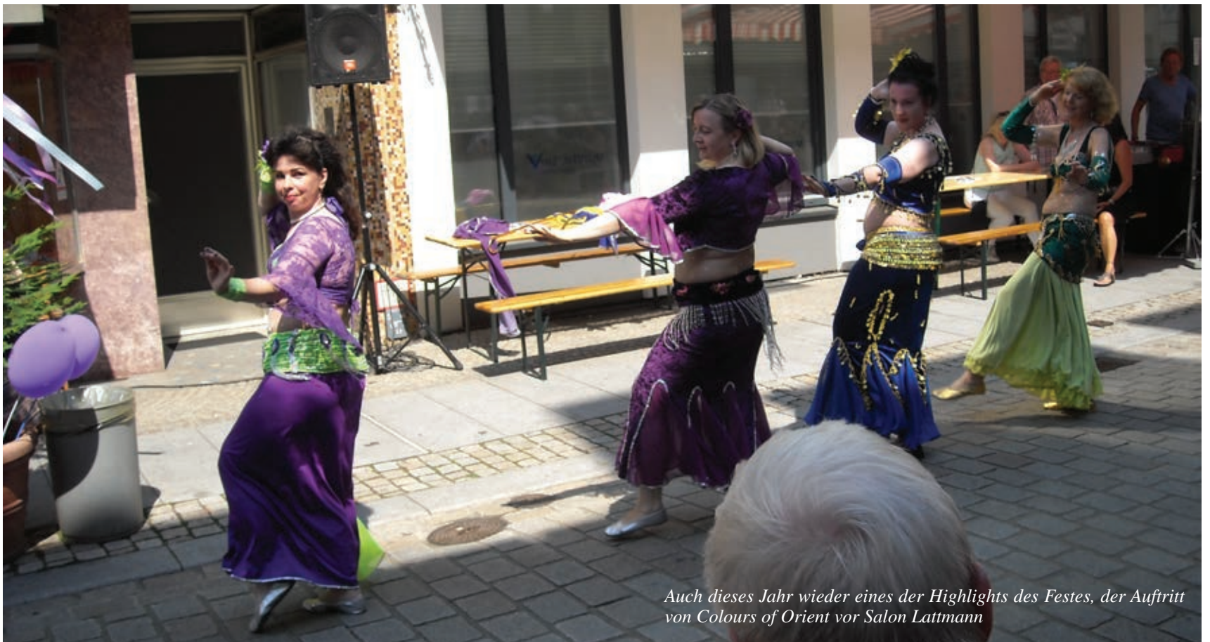
Auch dieses Jahr wieder eines der Highlights des Festes, der Auftritt von Colours of Orient vor Salon Lattmann