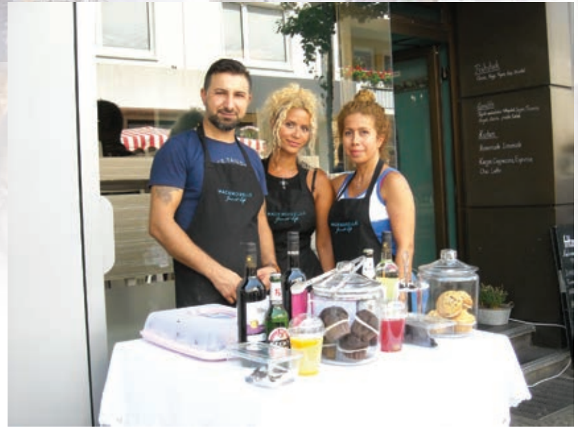
Das Team von Cafe Mademoiselle