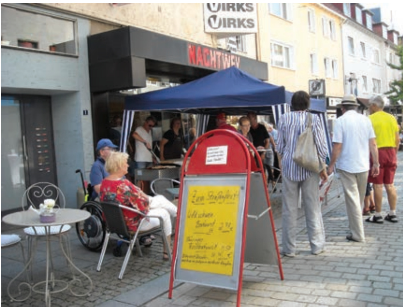
Fleischerei Nachtwey bot neben Thüringer Bratwurst Wildschweinbratwurst und Kostproben von Wildspezialitäten an