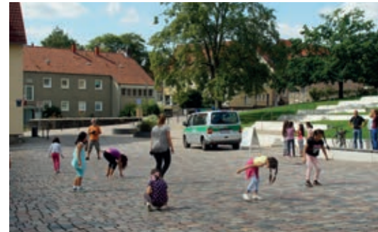
Aktion Spielstraße 2017