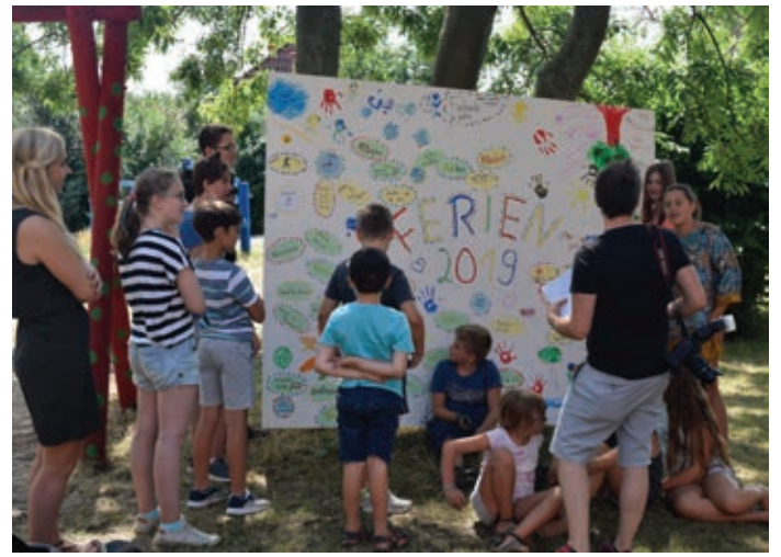
Ideen Ferienprogramm: Die Kinder und Jugendlichen visualisierten ihre Ideen für das Ferienprogramm 2019 und stellten diese der Öffentlichkeit vor.

Zu den Ideen der Kinder und Jugendlichen zählten unter anderem Ausflüge zum Beispiel in Freizeitparks oder Städte, Outdoor-Aktivitäten wie Kanufahren oder auch Shuffle-Tanz-Kurse. Auch ungewöhnliche Dinge wie eine Prank-Show – „prank“ (englisch) bedeutet „Streich“ – wurden vorgeschlagen und werden ggf. umgesetzt. „Wir wollen, dass die Kinder und Jugendlichen ihre Freizeit so verbringen können, wie sie das möchten. Daher versuchen wir ein möglichst breites Angebot zu schaffen“,