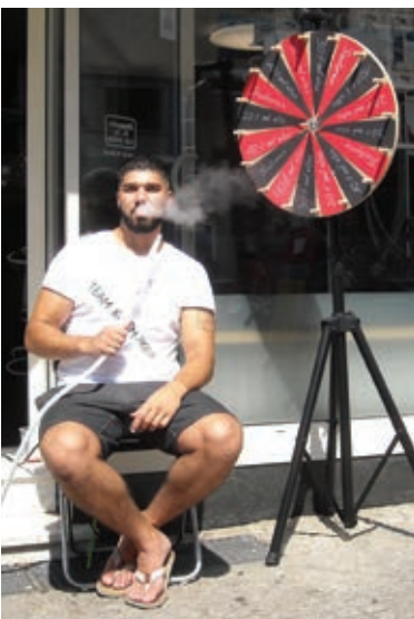
KM Smokes, seit kurzem neu im Kurzen Hagen, mit einem Glücksrad