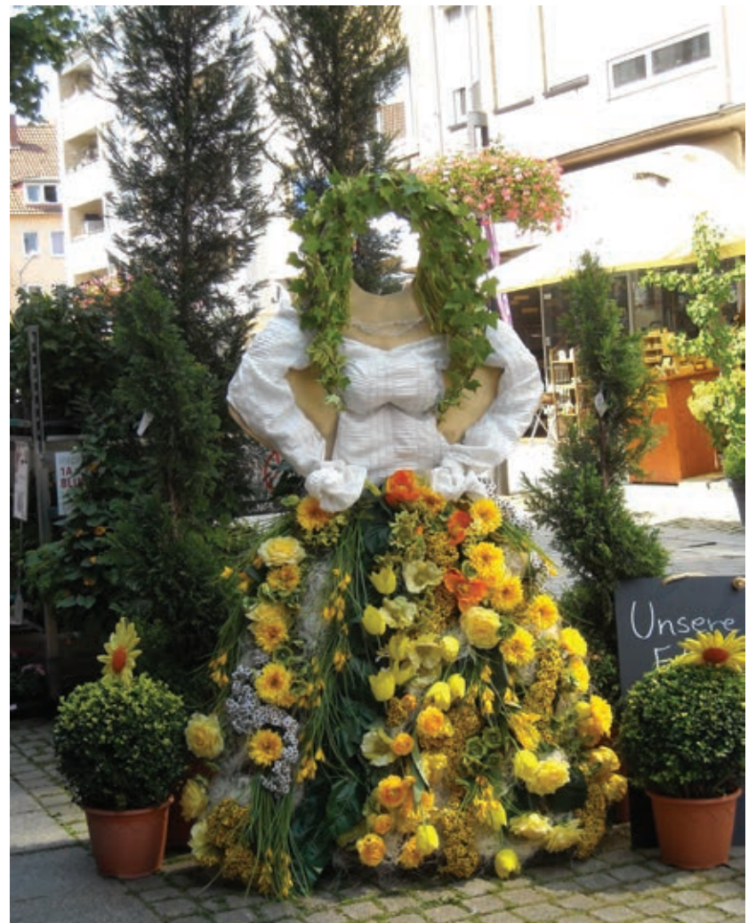
Wunderschön gestaltet die Fotobox von I A Blumen Lange