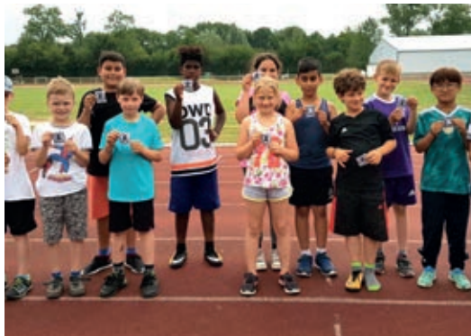
Kinder der Grundschule „Alter Markt“ mit ihren Schwimmabzeichen

Die Übergabe der Schwimmabzeichen fand am Mittwoch während des Sportfestes statt. Hier wurden auch die Kinder der vierten Klassen geehrt, die es schafften das Deutsche Sportabzeichen in Bronze und Silber abzulegen.