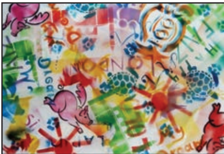
Klein und Groß können in der Kunstschule beim Malen, Spraysen, Zeichnen oder Trickfilmen kreativ werden.