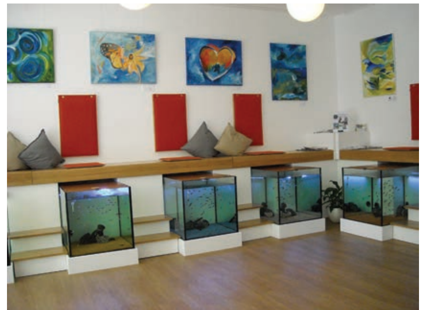
Seit einem Jahr am Kurzen Hagen – Knabberzeit