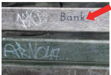
Diese Bank steht am Aussichtspunkt im Galgenberg

Hier hat man extra, Gott sei Dank, den Hinweis angebracht. Das ist tatsächlich eine Bank. Wer hätte das gedacht.