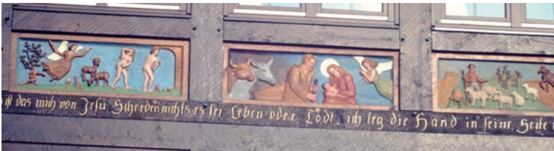
Text und Fotos: Karl Scheide