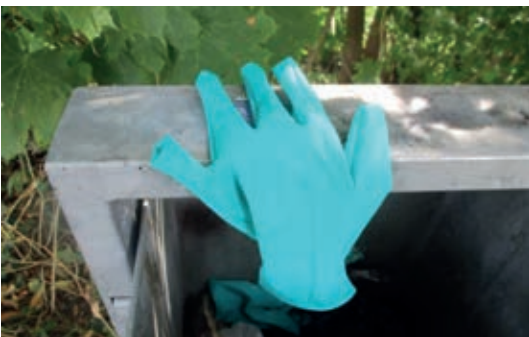
gesehen am Kehrwiederwall

Vielleicht wollt' ja der zweite flieh'n. Vielleicht gab's einen Bruderstreit. Wollte er in die Ferne zieh'n? Doch sieht man hier, er kam nicht weit.