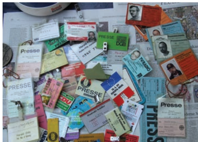
Ausweise und Akkreditierungen aus seinem Berufsleben (nur ein kleiner Ausschnitt) veranschaulichen, was in einem Reporterleben so alles zusammenkommt.

Bildband über den Hildesheimer Bahnhof fertig. Der Sohn eines der letzten Dampflokomotivführers war mit einem Verlag schon handelseinig, bis das Projekt urplötzlich platzte. „Bis heute habe ich keine Absage erhalten“ sagt der