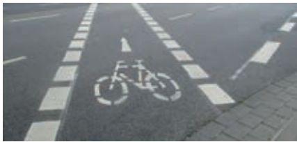
Weg „An den Sportplätzen“

Weil man g'rad in der Innenstadt die Radwege erneuert hat. Man kann nun schräg statt g'rade fahren. Ich glaub', das konnte man sich sparen.