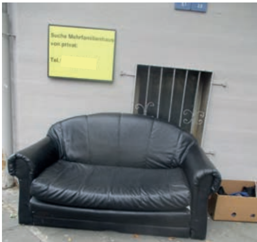
gesehen auf der Marienburger Straße

Das arme Sofa warf man hinaus. Wo soll es denn nun bleiben? Es sucht ein Mehrfamilienhaus. Man kann's auch übertreiben.