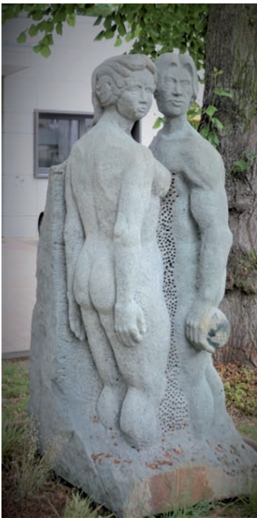
Bericht und Fotos: Dieter Goy

Das Bildhauen entdeckte er für sich vor 14 Jahren aus traurigem Anlass, seinen Entwurf für den Grabstein zum Tod seiner Frau führte er selbst aus. Seitdem sind weitere Werke entstanden, Marmor ist das bevorzugte Steinmaterial. Ideen werden mit anderen Künstlern ausgetauscht. Die hat er um sich scharen können, seitdem er das Krehla - vielen sicher noch als romantische Obstweinschenke und Restaurant im Moritzberg bekannt - vor 11 Jahren übernommen und als Atelier ausgebaut hat. Zwölf Malerei-Schaffende und vier Bildhauer bringen Kunstverstand und handwerkliche Fähigkeiten kreativ zusammen. Das Thema „Mensch“ ist dabei wegweisend. Und er selbst? „Unabhängigkeit und das entstandene Wohlgefühl durch und mit den Mitschaffenden in inspirierender Umgebung ist alles Leben wert!“