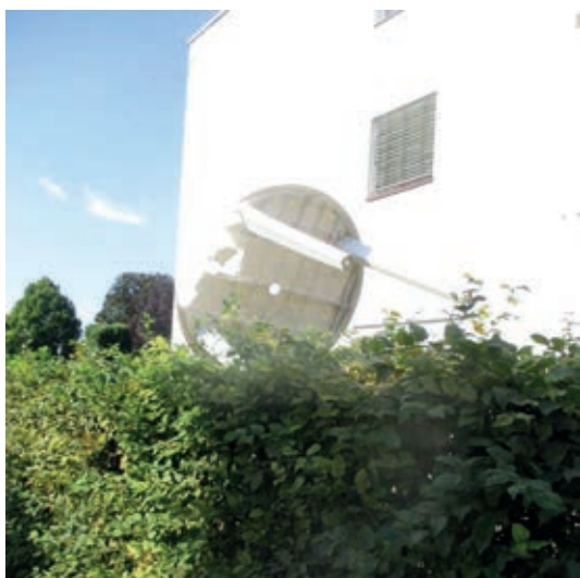
gesehen in der Alfelder Straße

Bin zur Erkenntnis dann gekommen: Das Ding kam von 'nem fremden Stern. Da hab' ich schnell Reißaus genommen. Die Wesen treff' ich nicht so gern.