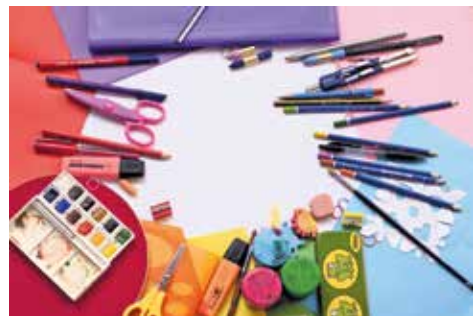
Mit dem Schulstartprojekt unterstützt der Landkreis Hildesheim Familien mit geringem Einkommen.

– AWO Kreisverband Hildesheim-Alfeld, Telefon: 051 21/1 79 00 00, Website: www.awo-hi.de