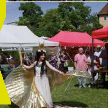
Text und Plakat: Sandra Strüber