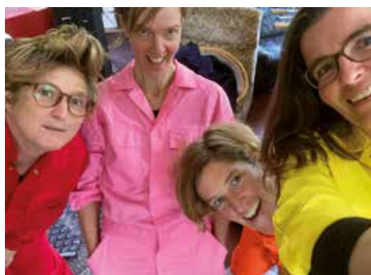
Das Miteinander wird gefeiert und unsere Verwandtschaft mit allen Wesen ernst genommen. In einer