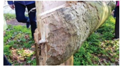
„Meister Bockert“ kennt keine Zahnprobleme. Na dann guten Appetit!

Nach dem grauen Winter beginnt jetzt wie ein Paukenschlag das große Blühen. Jede