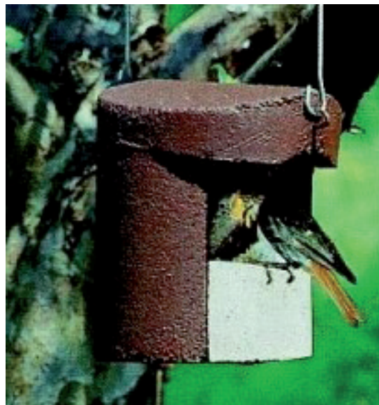
(Nisthöhle mit Marderschutzhülse (vornehmlich für Meisen) und Halbhöhle - Text und Fotos: Dieter Goy

Wer etwas dafür tun will, dass unsere gefiederten Freunde das Leben leichter haben und sich auch in der Nähe des Menschen wohl fühlen, kann im eigenen Bereich - sei es im Garten oder auf dem Balkon - etwas dafür tun. Und Freude haben bei der Beobachtung! Das Anbringen von Nisthilfen ist eine gute Maßnahme, aber nicht alles! Es empfiehlt sich in diesem Fall Haus und Garten naturnah zu gestalten. Denn heimische Stauden, Kletterpflanzen und Sträucher sind die Nahrungsgrundlage für viele Tiere und bringen außerdem Farbe in das eigene Umfeld. Tipps zur naturnahen Gestaltung von Haus und Garten finden Sie in den NABU-Broschüren „Gartenlust“ und „Wohnvergnügen“, erhältlich im NABU-Büro in Hildesheim, Dingworthstraße 38 (Montag und Freitag geöffnet von 16 bis 18 Uhr) und unter www.nabu.de .