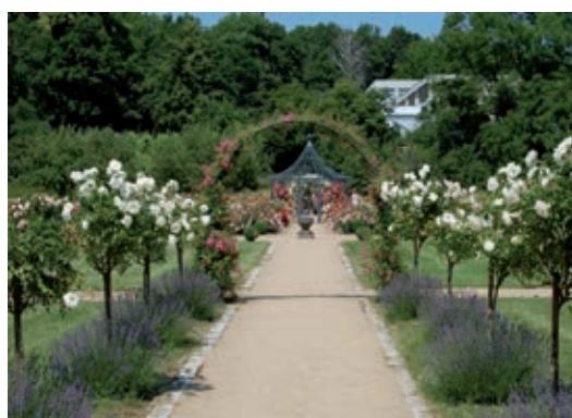
(Magdalenengarten im Sommer)

renamt immer zeitlich begrenzt ist, haben wir Helfer, die schon viele Jahre mit dabei sind aber auch immer wieder andere, die diese Tätigkeit nur eine begrenzte Zeit ausüben können. Von daher wird immer wieder nach neuen Helfern gesucht.