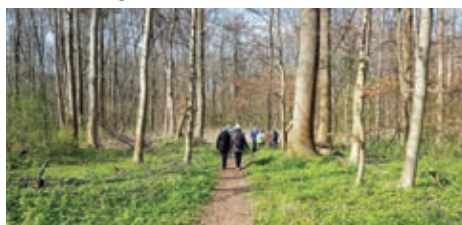
Oben grau, unten grün mit Farbtupfern. Frühling im Haseder Busch.

Auf dem sonnenbeschienenen Waldboden ist längst der Frühling ausgebrochen. Bevor das Laub austreibt und das Blätterdach den größten Teil des Sonnenlichtes schluckt, müssen die hier unten lebenden Pflanzen ihr Fortpflanzungsgeschäft erledigt haben. Da es am Boden windärmer und frostgeschützter ist, erwachen die Bodendecker früher als die Bäume und Sträucher. Außerdem profitieren sie von einem genialen Trick der Natur: Sie lagern in saftigen Zwiebeln und dicken Rhizomen Vorräte ein. Geschützt im Boden überstehen sie so die kalte Jahreszeit. Bei einigen werden überdies im Herbst Knospen mit Stängeln, Blättern und Blüten angelegt, die im Frühling rascher austreiben können.