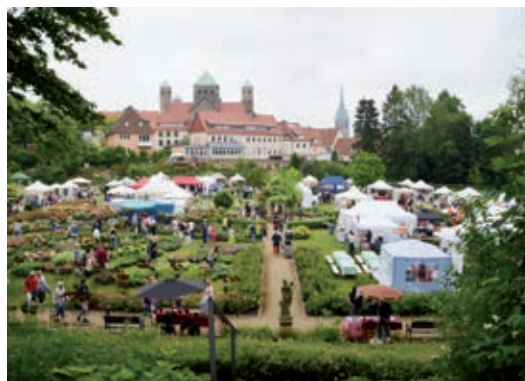
(Magdalenengartenfest 2018)

Mit diesem Freundeskreis zusammen soll unter anderem das ständige Bemühen intensiviert werden, ehrenamtliche Helfer für den Garten zu gewinnen. Es gibt derzeit 16 ehrenamtliche Helfer, da das Eh-