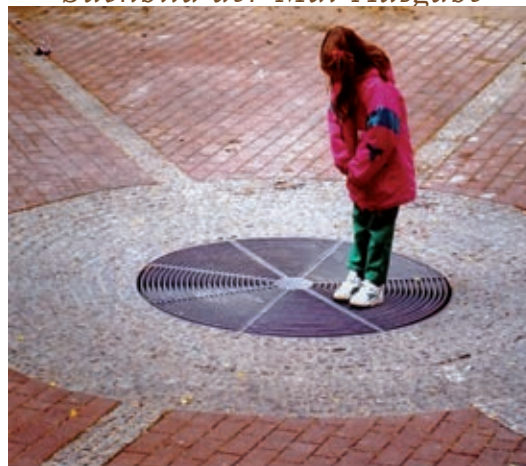
Das Mädchen steht auf einem ehemaligen Brunnen. Wo befindet sich dieser Brunnen im MichaelisQuartier?