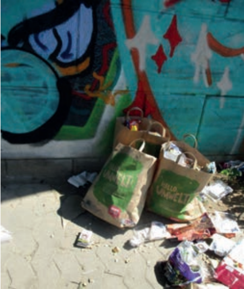
gesehen an der Fünfbogenbrücke

Hallo Umwelt lese ich hier. Man nimmt statt Plastik nun Papier. Gut wär's, wenn man's richtig macht. So war das wohl nicht gedacht.