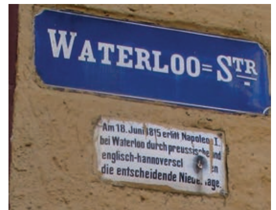
an einem Haus in der Waterloostraße

Ein großer Feldherr war er schon, der kleine Mann Napoleon. Bei Waterloo war es dann aus, so liest man es an diesem Haus. Das Haus ist unbewohnt, jedoch, Napoleon hängt immer noch.