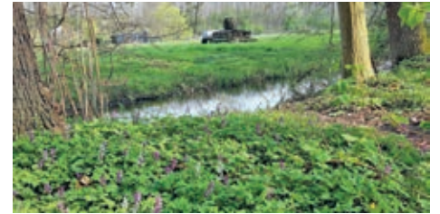
Frühlüher im Haseder Busch

Also, fetzige Musik an (Alexa starte K50p von laut.fm oder im Internet https://laut.fm/k50p ) und schon wischt und schrubbt es sich viel leichter. Auf den Feldern duftet es bereits nach Gülle und erste Hochdruckreiniger sind zu hören.