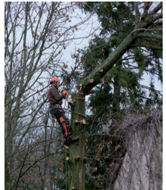
(Text u. Foto: Karl Scheide)

Bewundernswert ist die Artistik eines Baumkletterers, der bei Regen und Wind seine Arbeit in den Baumkronen verrichtete.