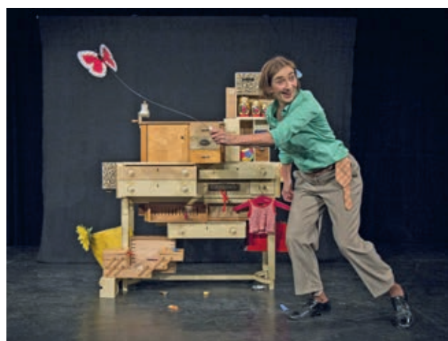
Das Nachwuchstheaterformat SCHREDDER ist eine Hausreihe des Theaterhaus Hildesheim e.V. und bietet jungen Theatermacher*innen die Möglichkeit sich experimentell zu erproben und zu erforschen. Das Konzept des SCHREDDERS beruht auf einer simplen Idee: Was immer man in den Schredder hineingibt – egal wie sperrig, groß und komplex es auch sein mag – wird zerteilt, in einzelne Aspekte zerlegt und dadurch überhaupt erst überschaubar, einsehbar und vielleicht sogar verständlich. Der diesjährige Schredder beschäftigt sich mit dem Thema Wissenschaft:

Was ist Wissenschaft? Ist Wissenschaft das, was Wissen schafft? Hat Wissenschaft alle Antworten? Oder ist sie lediglich die Suche danach? Worum dreht sich die heutige Suche nach dem Wissen und was ist das eigentlich? Was ist, wenn Wissenschaft plötzlich zum Thema und nicht mehr nur zur Methode wird? Wenn sie nicht mehr nur selbst Fragen aufwirft, sondern selbst in ihrem Wesen hinterfragt wird? Wer sind die Wissenschaftler*innen? Wo wird Wissenschaft missverstanden oder missbraucht? Wo bietet sie eine Stütze, eine Hilfe, die Rettung? Wo ist das Licht, wo der Schatten des Wissens und der Wissenschaft, die danach sucht? Wie weit darf die Wissenschaft gehen? Und wie weit werden die Gruppen gehen? Erste Arbeitsergebnisse werden bei den Testläufen gesichtet und bei Nachgesprächen