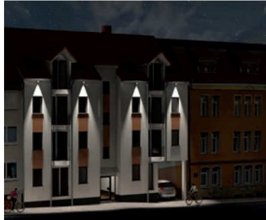
(Text: Peter Spilker)