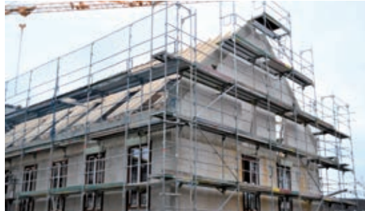
(Die Arbeiten am kwg-Projekt gegenüber der Magdalenenkirche schreiten voran - Fotos: Dieter Goy)