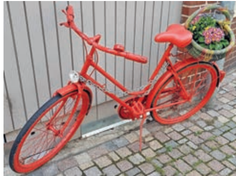
Der Frühling kommt – gesehen beim Schärpling

Wir hatten jetzt lange genug Winter-Blues, trübes Wetter und frühe Dunkelheit. Da könnten wir mal wieder etwas Sonnenschein gebrauchen. Das Wetter ist bisher zwar noch ein ziemliches Hin und Her, da geht es von Minus- bis zu zweistelligen Plusgraden und wieder zurück. Aber im März hoffen wir auf einen Hauch von Frühling mit ersten warmen Sonnenstrahlen und beständigerem Wetter.