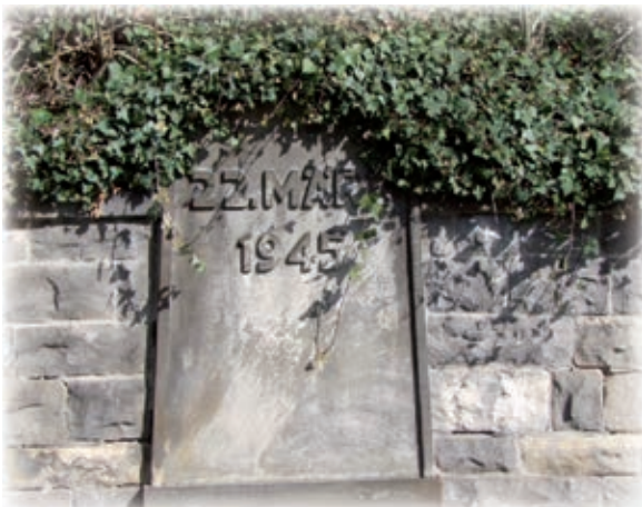
(Gedenkstätte - Hinterhof Verlag Olms)