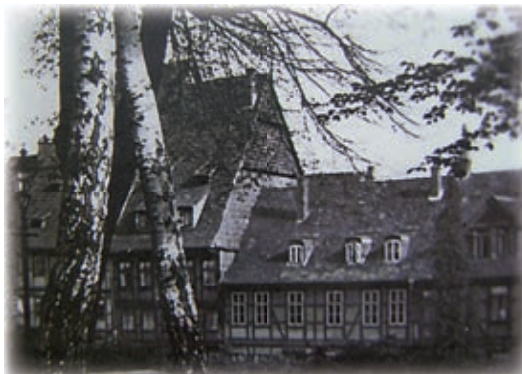
(Vorkriegsfoto Langer Hagen)