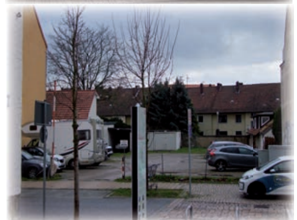
(Baulücke Langer Hagen)