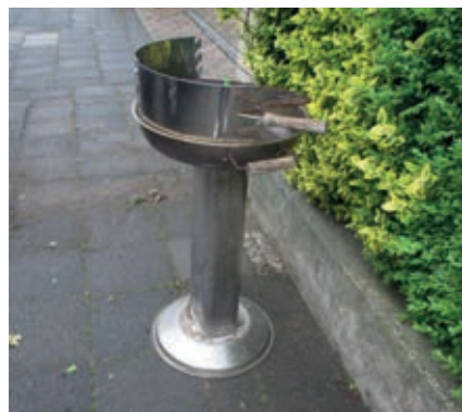
Diese „Einladung“ zum Grillen fand ich in der Gartenstraße