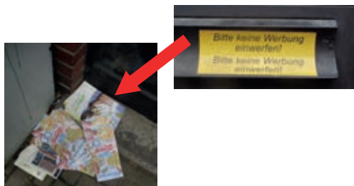
keine Werbung im Briefkasten, aber in der Haustürecke, dieses „Missverständnis“ fand ich in der Kardinal-Bertram-Straße

Werbung will man hier wohl nicht. Wofür klar der Aufdruck spricht. Missverstanden, wie es scheint. So war das wohl nicht gemeint.