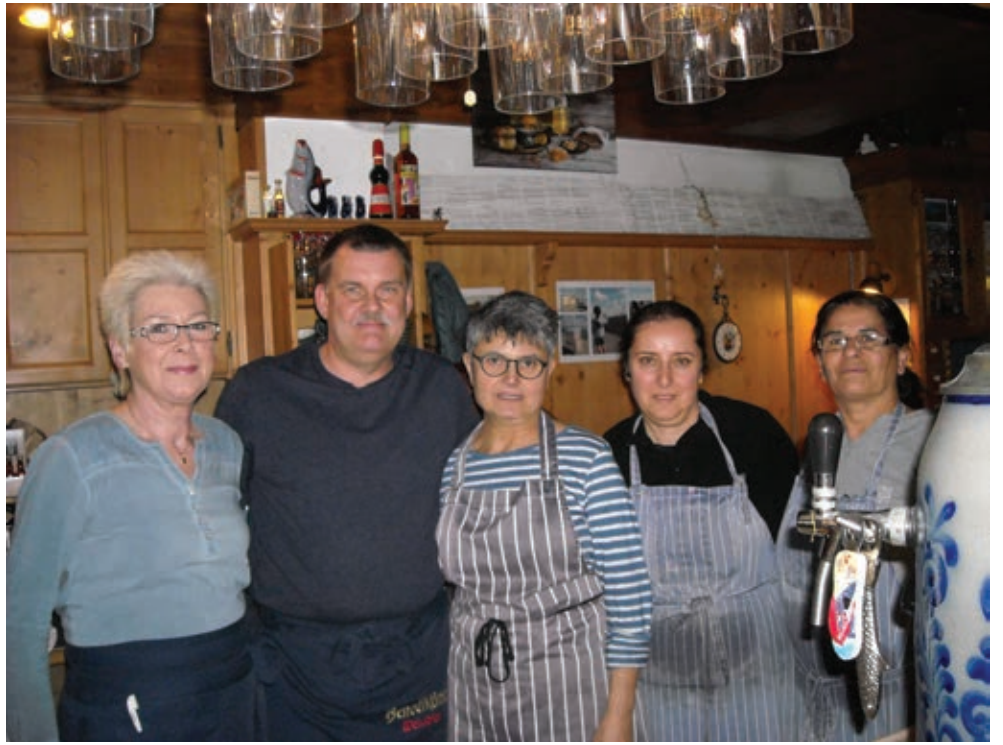
Das Team von Mobbi Dick