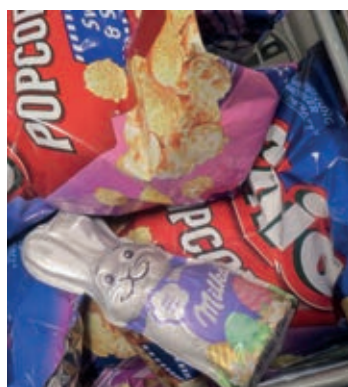
Gesehen in einem Supermarkt

Ostern ist doch längst vorüber. Blieb der arme Hase über? Fand er dann nicht nach Haus zurück? Ich hoffe sehr, er hat noch Glück und es nimmt ihn jemand mit. Na dann, guten Appetit.