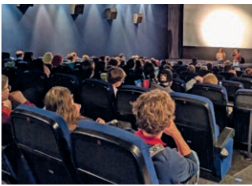
Gut gefüllter Kinosaal bei der Anmoderation eines Films.