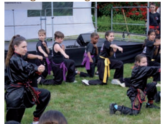
Text und Fotos: Karl Scheide

Diese Sponsoren sind bei der Finanzierung der Doppelseite über da