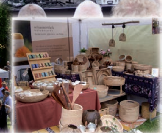
Text: Dieter Goy