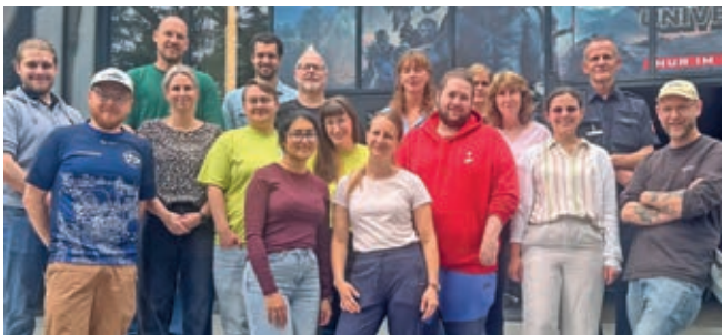
Das Orga-Team des Schulfilmfestes 2026.s

Das Hildesheimer Schulfilmfest im Thega Filmpalast stand in diesem Jahr unter dem Motto „Demokratie und eine resiliente Gesellschaft“. Schülerinnen und Schüler aus Stadt und Landkreis waren eingeladen, gesellschaftliche Themen auf kreative, lebensnahe und zugleich unterhaltsame Weise zu entdecken und zu reflektieren. Mit großer Resonanz: An den Veranstaltungstagen 16. und 17. Juni besuchten 500 Schülerinnen und Schüler aus zwölf Schulen kostenlos das Hildesheimer Schulfilmfest und setzten sich gemeinsam mit aktuellen gesellschaftlichen Fragestellungen auseinander.