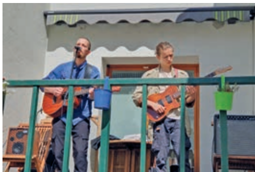
Singer-Songwriter-Duo „Luowaters“ begleitete das Fest vom Balkon aus mit seiner Musik.