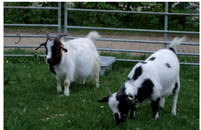
Bild 1: Geschneiderte Kostüme Bild 2: Zauberer sorgt für Unterhaltung Bild 3: Blick in den Garten Bild 4: Folklore - Stadtführer Bild 5: Streichelzoo - Angebot für Kinder