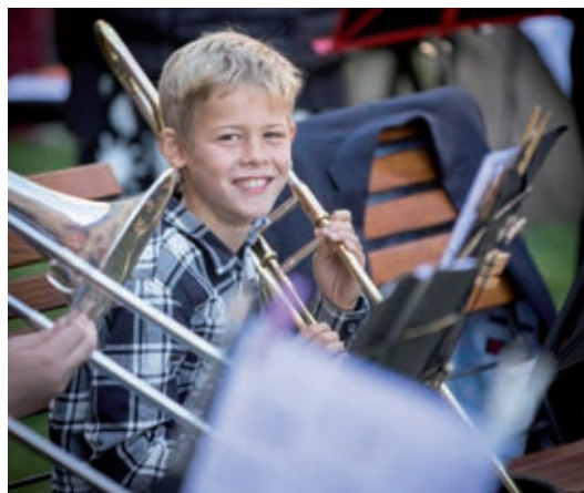
Bild zum Text rechts: Trompete und Posaune lernen im Posaunenchor St. Michael - Foto: Angelika Rau-Culo

Text und Foto: Grit Schubert, GS Alter Markt