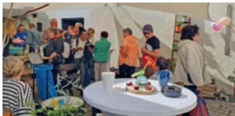
Zahlreiche Gäste drängten sich um den Getränke- und Waffelstand.

Zehn Jahre ist es nun schon her, dass die 1880 gegründete Herberge zur Heimat unter das Dach der Dia-