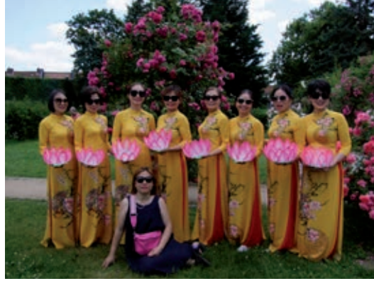
Frauengruppe aus Vietnam

aktiv mitzugestalten, ohne dabei stets unter sich bleiben zu müssen.