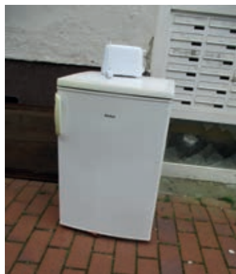
Gesehen an der Steingrube

Ein Kühlschrank und ein Toaster, wie nett. Die Küche wäre nun fast komplett. Den Herd dazu kann ich nicht seh'n. Da muss ich wohl noch weiter geh'n.