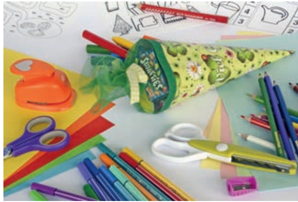
Rechtzeitig vor dem Start in das neue Schuljahr können einkommensschwache Familie finanzielle Mittel aus dem Schulstartprojekt beantragen.

Caritasverband für Stadt und Landkreis Hildesheim e.V., Telefon 051 21/1 67 72 38, Website: www.caritas-hildesheim.de