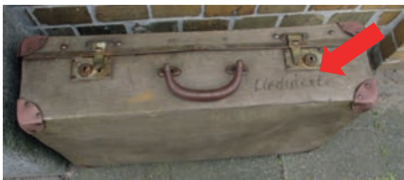
Diesen Koffer entdeckte ich in der Gartenstraße

Ich schau' ihn mir genauer an und staune, was ich lesen kann. Liedertexte sind darin. Auch vom Koffer in Berlin?