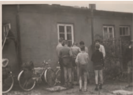
(Nutzung der Fläche um 1960 - Jungengruppe vor Abfahrt einer Fahrradtour - Foto: Privat)