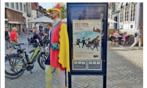
Hat sich gelohnt! Auf der Kulturroute unterwegs in Hamelns Altstadt.

Das Hamelner Stadtmuseum liegt direkt in der beschaulichen Fußgängerzone. Hier dreht sich einiges, aber nicht alles um die Rattenfänger-Sage. Sowohl die Dauerausstellung zur Frühgeschichte des Weserberglands oder der Stadt im Mittelalter, als auch die Sonderausstellungen, hinterlassen bei Besuchern einen bleibenden Eindruck. Am Rande der Altstadt führt eine