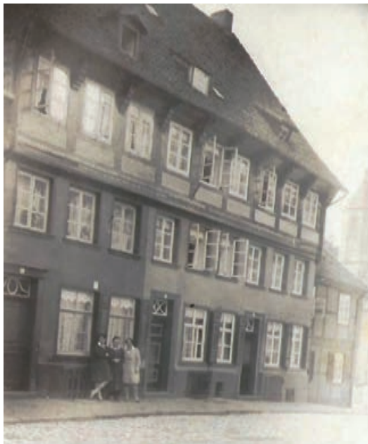
So sah es früher dort aus. Dieses alte Foto zeigt die Häuser in der Mühlenstraße 18, 19, 20 und 21 - Aufnahme ca. 1940. Die Häuser 18, 19 und 20 waren ursprünglich ein Haus und gehörten zur Propstei von S. Maria Magdalena.