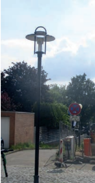
Die Laterne in der Mühlenstraße, gegenüber der Magdalenenkirche wurde ausgetauscht.

Ach, wie schade! Wieder g'rade! Muss ich nun doch nach Pisa fahren? Ich glaub', das werd' ich mir ersparen.