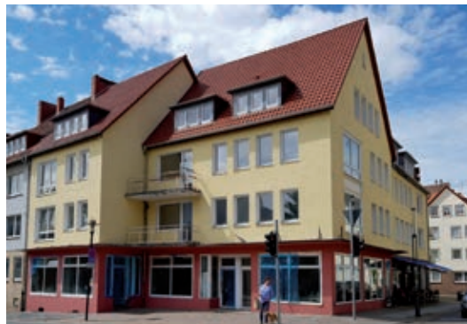
Immobilie Ecke Dammstraße/Burgstraße Text und Foto: Peter Spilker

Womöglich könnte der Anblick des Gebäudes durch neue Eigentumsverhältnisse in Zukunft erfreulicher werden: Das kombinierte Wohn- und Geschäftshaus soll am 5. Juli 2021 am Amtsgericht Hildesheim im Wege der Zwangsvollstreckung versteigert werden.