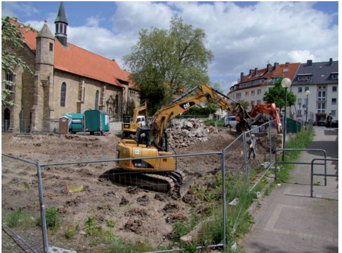
Bagger- und Bohrarbeiten am Baugrundstück Mühlenstraße