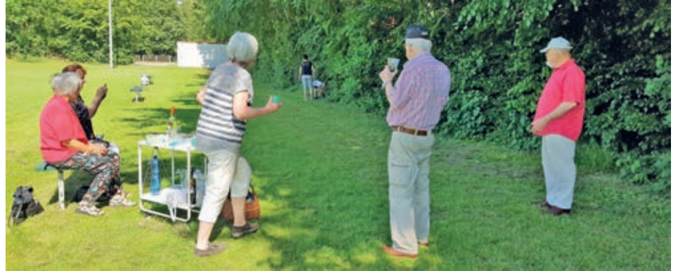
Endlich wieder möglich! Sommer, Sonne und draußen nette Leute treffen.

Kultur & Lebensfreude pur für die aktive Generation 50plus Unabhängig, ehrenamtlich und ohne jedes finanzielle Interesse. Just For Fun.