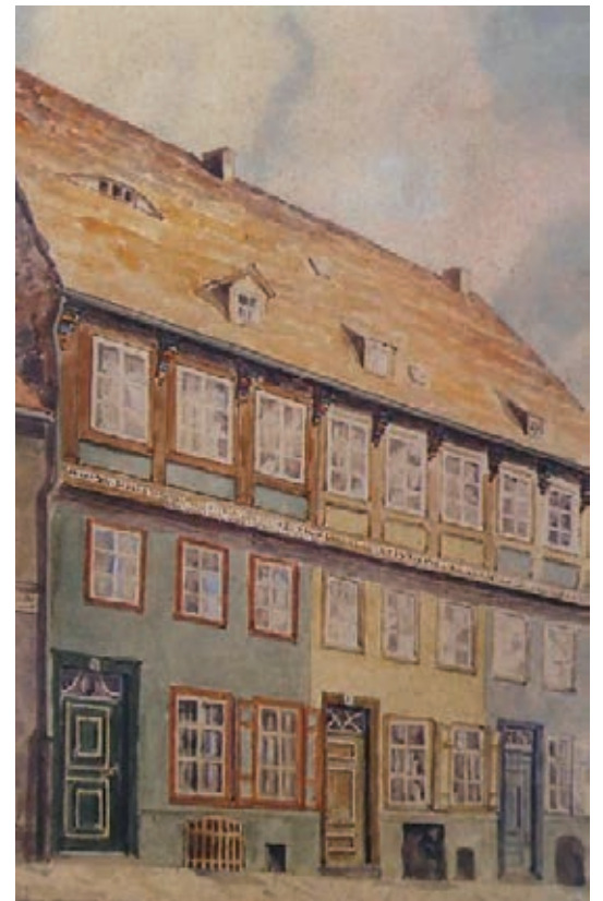
Das Aquarell zeigt die Häuser Nr. 18, 19 und 20 in der Mühlenstraße - Foto: Privat

Diese Sponsoren sind bei der Finanzierung der Doppelseite über da