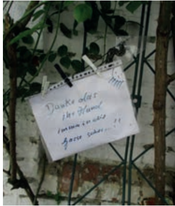
Am Kehr wieder

Wer einen Hund hat, sollte wissen, was beim Spaziergang immer Pflicht: Hat sich der Liebling ausgesch.... macht man es weg - er kann das nicht.