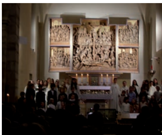
Adventskonzert in der Magdalenenkirche