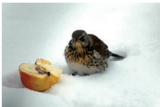
Text: Dieter Goy

Wir machen am Sonntag, 12. Januar 2026 von 10 Uhr bis 11 Uhr im Magdalengarten mit! Wer dabei sein möchte ist herzlich willkommen! Geht auch spontan. Treffpunkt ist an der Nordseite im Garten. Im letzten Jahr haben sich immerhin 15 Vogelarten sehen oder hören lassen. Mal sehen, wie es dieses Mal aussieht. Übrigens: Sie können vom 9. Januar bis zum 11. Januar auch bei sich zu Haus zählen und melden. Alles dazu finden Sie im Internet unter: www.stunderwintervoegel.de im Internet.