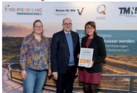
Das RPM ist ausgezeichnet als besonders familien- und kinderfreundlich