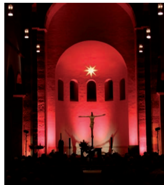
Liedersingen in St. Michael

für eine stimmungsvolle Adventsstunde für die zahlreichen Gäste in St. Michael.