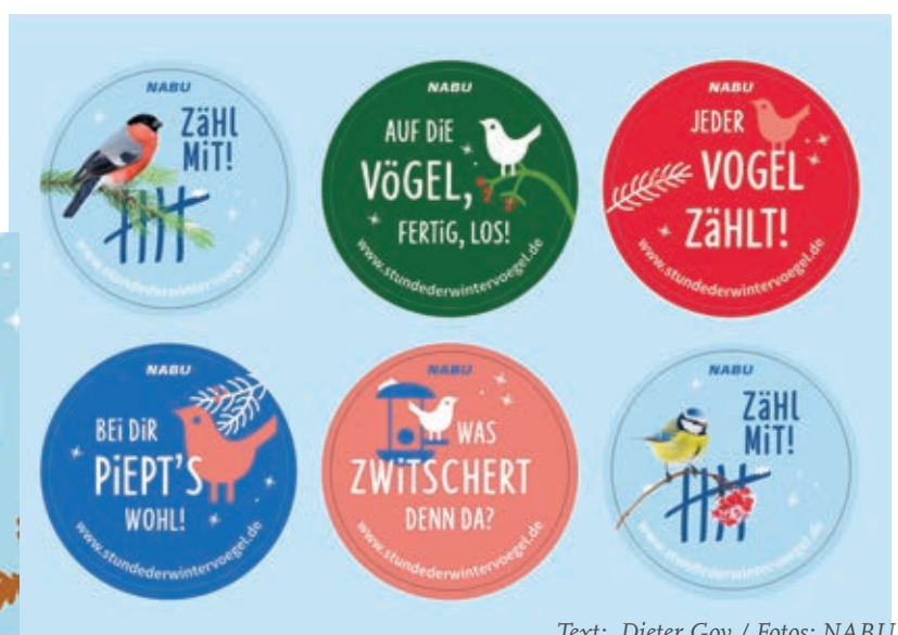
Text: Dieter Goy

Diese Sponsoren sind bei der Finanzierung der Doppelseite über da