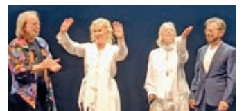
Die echten ABBA-s vor 3000 geladenen Fans bei der Weltpremiere: Benny Andersson, Agnetha Fältskog, Anni-Frid Lyngstad, Björn Ulvaeus

taren nicht erkennen, bei den Mega-Größen ein wenig. Und hin und wieder scheinen sie doch auf einen zuzukommen aus der Dunkelheit. Die 10 Live-Musiker konnten jedoch nicht mit den ABBA-taren interagieren, d.h. sie standen etwas näher am Bühnenrand zur linken. Frida konnte also nicht am Bein eines Gitarristen „herumfummelt“ wie es in ABBA the Movie zu sehen ist. Bei der Matinee am 18.12. gab es eine kleine Störung nach dem 2. Song und nach