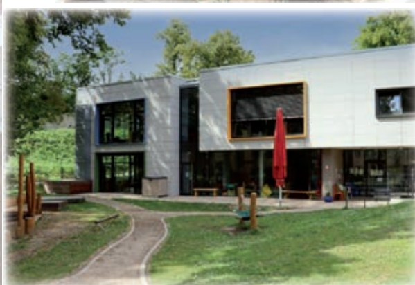
Text und Fotos : Peter Spilker