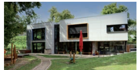
Fotomontage und Text: Lisa Kundt - Familienzentrum St. Bernward

In diesem Sinne wünscht das Familienzentrum St. Bernward allen Leserinnen und Lesern eine fröhliche, besinnliche Adventszeit und einen guten Start in das neue Jahr 2023!