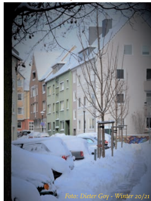
Winter 20/21

Die Redaktion wünscht Ihnen ein friedliches und gesundes Neues Jahr 2022.