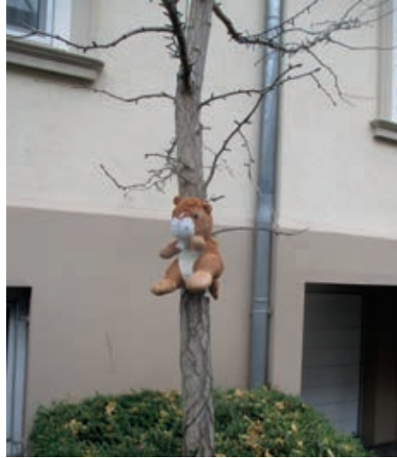
diesen süßen Kerl sah ich in der Gartenstraße

Da lacht mich dieses Kerlchen an. Ich schau' es an und staune, wie hoch der „Biber“ klettern kann. Schon hab' ich gute Laune.